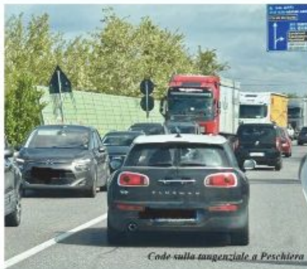
Code sulla tangenziale a Peschiera