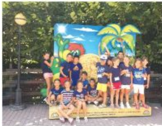
Rombolai di Castelnuovo in una delle passate edizioni del CER

Il Centro estivo si svolgerà dal 1° luglio al 9 agosto, dalle 8 alle 16, alla scuola primaria di Castelnuovo, il Campus medie (riservato alle classi prima e seconda) si terrà dal 29 luglio al 9 agosto, dalle 8 alle 13, al Centro di via Filiselle, mentre il Campus occupazionale (per ragazzi della classe terza della scuola secondaria di primo grado alla quinta della secondaria di secondo grado) proporrà due moduli: dal 1° al 12 luglio e dal 15 al 26 luglio, dalle 8 alle 13, sempre al Centro di via Filiselle.