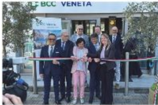
L'inaugurazione della filiale di Peschiera