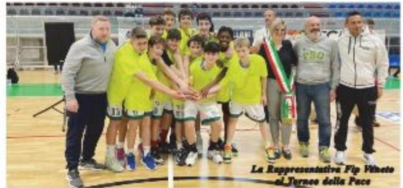
La Rappresentativa Fip Veneto al Torneo della Pace