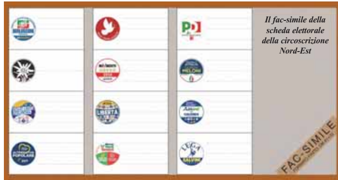
Il fac-simile della scheda elettorale della circoscrizione Nord-Est

Con le elezioni europee, i cittadini dell'Unione Europea eleggono i propri rappresentanti al Parlamento Europeo. I membri del Parlamento Europeo, insieme ai rappresentanti dei governi dei paesi dell'UE, hanno il compito di creare e approvare tutte le nuove dispo-