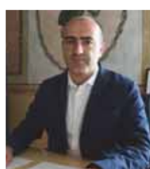
Il sindaco Fabrizio Bertolaso

Il consumo e l'abuso di bevande alcoliche si pone in stretta correlazione con altri fenomeni deprecabili come gli atti vandalici al patrimonio pubblico, il disturbo della quiete pubblica con grida e schiamazzi in ore notturne, l'abbandono di rifiuti, spesso di bottiglie di vetro frantumate. Contestualmente al divieto di detenzione e consumo, nelle suddette aree rimane vietato l'abbandono di contenitori vuoti di alimenti e bevande, rifiuti ed oggetti che contribuiscono al degrado urbano o potenzialmente pericolosi per i fruitori degli spazi pubblici. La violazione dell'ordinanza stabilita dal primo cittadino di Sommacampagna è punita con una sanzione amministrativa da 25 a 500 euro e il sequestro e la confisca delle bevande alcoliche trovate al momento dell'accertamento da parte delle Forze dell'Ordine.