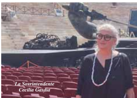
La Sovrintendente Cecilia Gasdia

gione perché la prima si tenne nel 1913, quindi quest'anno sarebbe il cento decimo anno dall'inizio. Le guerre mondiali e la pandemia hanno però interrotto la numerazione progressiva dei Festival e, quindi, quello che doveva capitare l'anno scorso è cascato quest'anno. Un traguardo che segna un momento di transizione storico: dalla tradizione al futuro dell'Arena di Verona. Che non vuol per forza dire