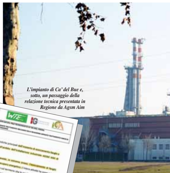
L'impianto di Ca' del Bue e, sotto, un passaggio della relazione tecnica presentata in Regione da Agsm Aim

Infine c'è la parte che riguarda l'aria: "i fumi depurati verranno emessi in atmosfera mediante un ventilatore esaustore e un camino. La temperatura dei fumi sarà indicativamente di 120 °C, tale da