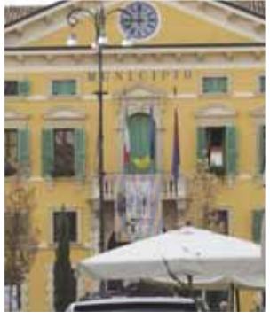
Lega attorno al 10 e Forza Italia attorno al 7. Non ci capisce quanto possano cambiare ed è difficile ipotizzare rivoluzioni clamorose. Quindi, perché? Fratelli d'Italia vuole la presidenza del Veneto in quanto primo partito e dei tre di coalizio-

Due sindaci - Pescantina e Valeggio - mandati a casa; un terzo - Castelnuovo - che approva il bilancio in "zona Cesarini" dopo un Consiglio comunale da brivido. Non c'è che dire: la campagna elettorale per le prossime Amministrative è partita in salita. E questo con i problemi dei cittadini c'entra davvero poco. Tra Fratelli d'Italia, Lega e Forza Italia - i tre partiti che compongono il Centrodestra - è lotta aperta per conquistare alle prossime elezioni del 9 giugno il maggior numero di voti possibile. Il terreno di scontro saranno le elezioni nei Comuni e in palio non ci sono neppure i posti a Bruxelles, all'Europarlamento: il vero obiettivo è lo scranno del prossimo presidente della Regione Veneto, la Baviera d'Italia, il cuore del Nordest, l'area di maggior espansione economica e di minore rappresentanza politica d'Italia. I rapporti di forza - al momento, sulla base dei sondaggi settimanali nazionali - sono abbastanza chiari: FDI viaggia attorno al 30%; la