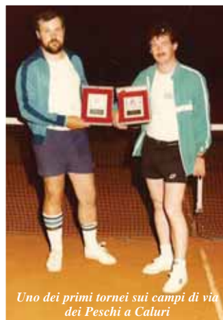
Uno dei primi tornei sui campi di via dei Peschi a Caluri