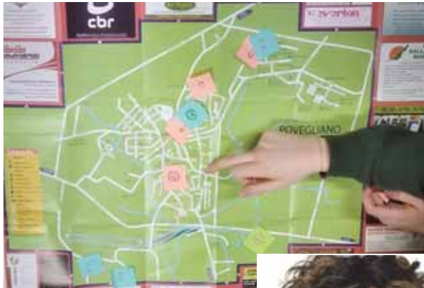
La mappatura del territorio da parte dei ragazzi con i luoghi del cuore di Povegliano e quelli bisognosi di cura

Per quanto riguarda gli altri progetti, tra febbraio e marzo ripartirà il "Ci sto? Affare fatica!" che la scorsa estate ha riscosso un notevole successo: "Le persone che vedevano i ragazzi li hanno "adottati": gli offrivano la merenda e gli facevano i complimenti. Un bel progetto" sottolinea la sindaca. La novità dei prossimi mesi è il progetto con i centri giovanili don Mazzi: «Durerà fino a settembre e sarà un progetto molto vicino alla tematica del tavolo giovani e dell'educativa di strada. Verranno infatti create delle attività per i ragazzi ma che partano da loro. Ci saranno degli educatori del centro don Mazzi che avvieranno una serie di attività sportive, ludiche