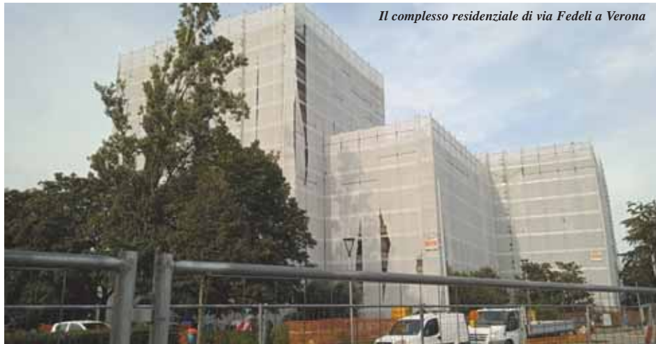
Il complesso residenziale di via Fedeli a Verona