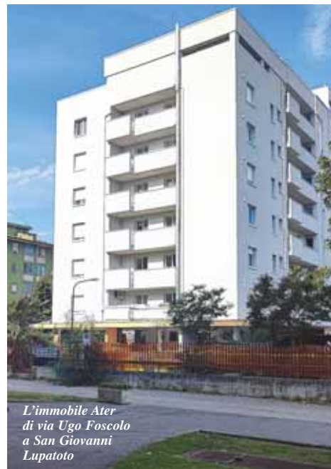
L'immobile Ater di via Ugo Foscolo a San Giovanni Lupatoto

Sono terminati da pochi giorni i lavori di riqualificazione di due complessi residenziali, con fondi regionali Por-Fesr 2014-2020, uno in via Fedeli a Verona (63 alloggi) e uno in via Ugo Foscolo a San Giovanni Lupatoto (52 alloggi). Gli interventi hanno visto una