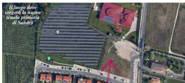
Il luogo dove sorgerà la nuova scuola primaria di Sandrà

«Il nuovo edificio scolastico è progettato in perfetta aderenza a tutte le normative, sia dal punto di vista prettamente scolastico, sia da quello strutturale e antisismico, con un bassis-