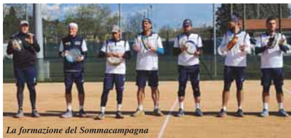
La formazione del Sommacampagna

Non è riuscito nell'impresa di mantenere la massima serie il Bardolino del