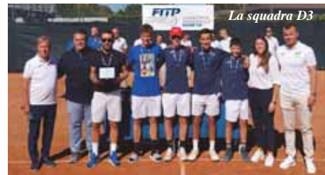
La squadra D3