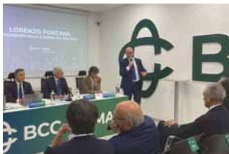
Il presidente della Camera Lorenzo Fontana interviene all'apertura dello sportello della Bcc di Roma

BCC Roma, infatti, su "invito" di Bankitalia ha rilevato nel 2015 la BCC Alta Padovana finita in crisi e da lì è partita la sua crescita nella nostra regione: oggi, il Veneto è la seconda regione italiana per presenza della BCC capitolina con 36 sportelli sui 184 totali dell'istituto, ma - soprattutto - dei 14,4 miliardi di raccolta complessiva ben 2,69 sono stati intercettati nel Veneto e dei 10 miliardi di impieghi nell'economia ben 1,37 sono finiti fra Padova, Venezia, Treviso e Verona di cui ben il 58% alle famiglie. Nel Veronese la BCC Roma è