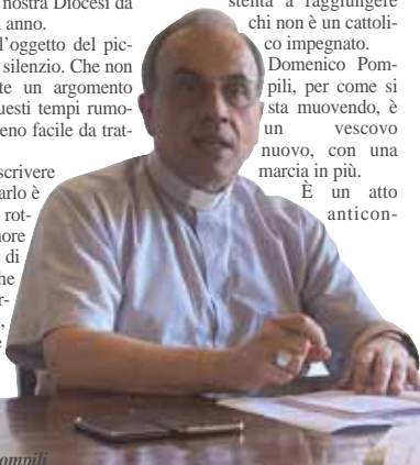
Il Vescovo di Verona Domenico Pompili