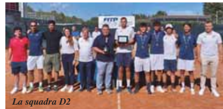
La squadra D2