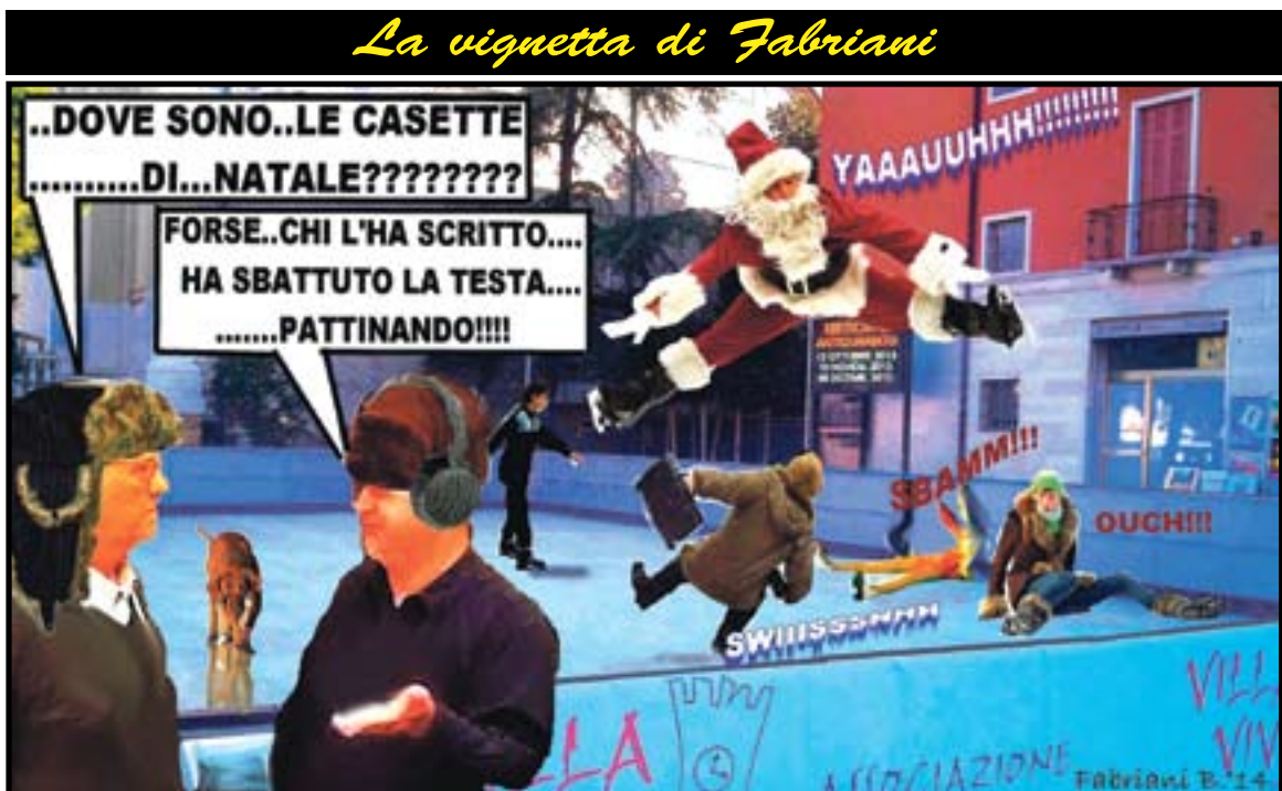
La vignetta di Fabriani