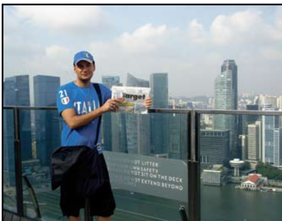
Da Singapore e Vietnam (Saigon) con Target. Due mondi completamente differenti.