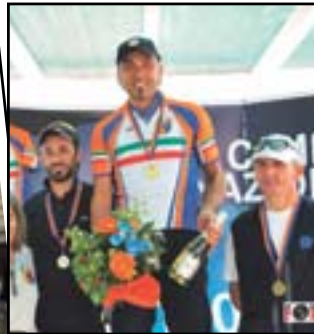
Braga regala alla società Olimpica Dossobuono il tricolore nella crono categoria Veterani Csi

Villafranca deve fare ancora molta strada dal punto di vista della raccolta differenziata. Troppi rifiuti abbandonati in giro e i costi così aumentano