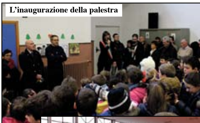
L'inaugurazione della palestra