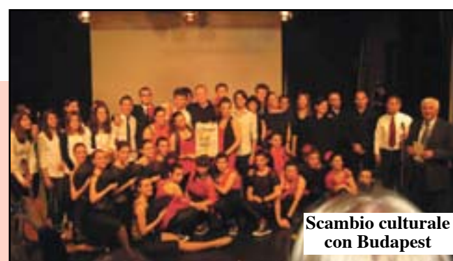
Scambio culturale con Budapest