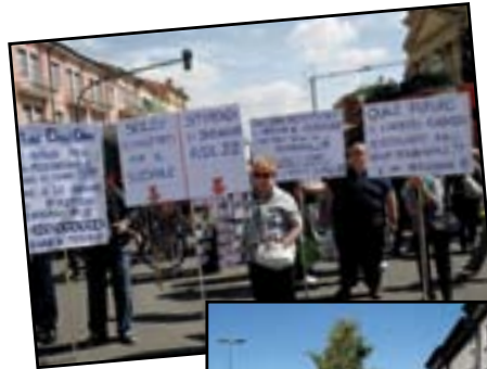
Via Bixio sede di polemiche roventi con il Pyrus che diventerà un Leccio

La presentazione del libro dedicato ai 50 anni dei donatori prima sotto il nome S.Camillo e poi Fidas