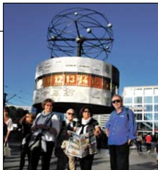
Due immagini del gruppo in visita a Berlino. Sopra in Alexanderplatz, cuore pulsante della città. Sotto davanti alla famosissima porta di Brandeburgo

di Edinburgo e Victoria & Albert Museum di Londra, fu voluto dal duca di Bedford. Fino al 4 maggio nella mostra "Le Grazie di Antonio Canova" (Museo e Gipsoteca Antonio Canova a Possagno; orario: mar-dom 9.30-18, lun chiuso; info 0423.544323) si potranno vedere entrambi i gruppi, quello "russo" e quello "inglese", restaurato; con i gessi e i due bozzetti, l'uno proveniente dal museo di Lione e l'altro di proprietà del museo di Bassano. Poi tempere, disegni, incisioni, sempre intorno al tema delle Grazie.