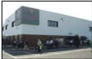
Sopra il nuovo consorzio A sinistra il progetto Parco Tione Cittadella Sport miseramente naufragato