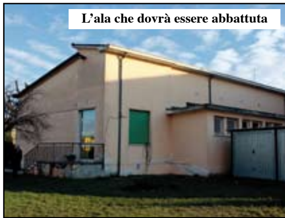
L'ala che dovrà essere abbattuta

per adattare gli spazi ad accogliere le classi spostate».