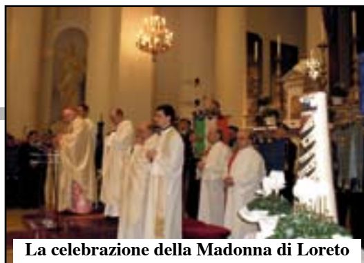
La celebrazione della Madonna di Loreto