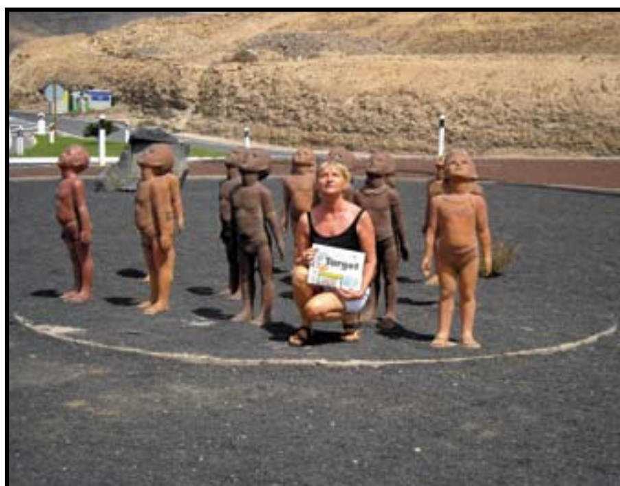
Una delle tante rotonde coreografiche create a Fuerteventura: questa si trova al Morro Jable.