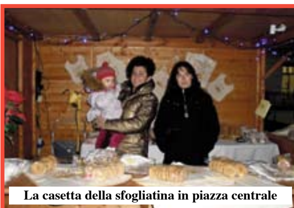
La casetta della sfogliatina in piazza centrale