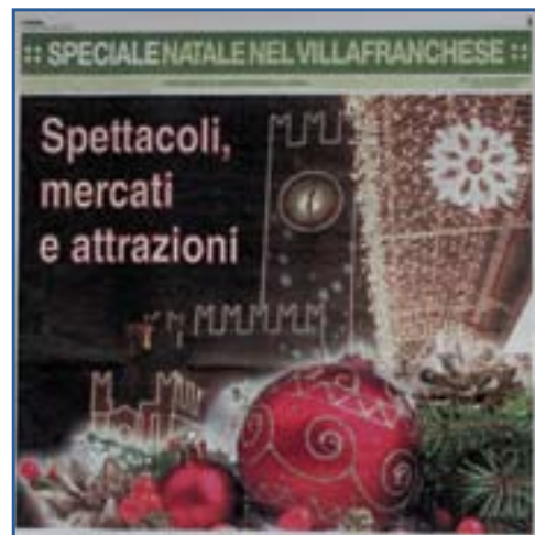
Lo speciale dell'Arena