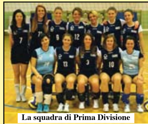
La squadra di Prima Divisione