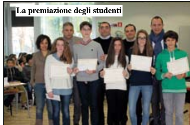
La premiazione degli studenti

Studenti bravi nello studio ma anche nel comportamento. Queste le motivazioni alla base delle cinque borse di studio della Scuola secondaria Rita Levi Montalcini di Dossobuono