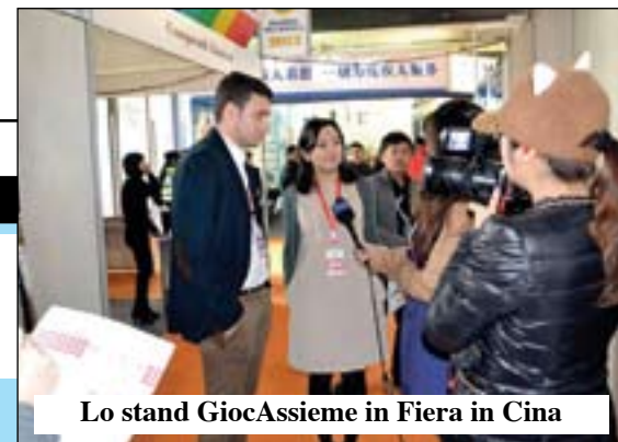
Lo stand GiocAssieme in Fiera in Cina

febbraio per firmare una fornitura molto importante per uno dei più grandi rivenditori di materiale sanitario di tutta la Cina. Il sindaco in questi giorni ci ha contattato per un preventivo per installare la struttura in molti parchi della città. Ora presenteremo questa struttura in Albania e partiremo con 5 rappresentanti, che copriranno gran parte dell'Italia, per proporre il prodotto a enti pubblici e associazioni. Abbiamo in cantiere altri 5 oggetti mirati per gli anziani, da installare nei parchi pubblici e nelle case di riposo».