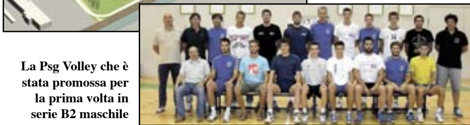
La Psg Volley che è stata promossa per la prima volta in serie B2 maschile

APRILE SCUOLE: via ai lavori di messa in sicurezza del liceo Medi ELEZIONI: sfida a 5: Faccioli, Martari, Pecoraro, Bicego, Tomicelli STRUTTURE: ok alla palazzina disabili e parking pro ospedale ROSEGAFFERRO: due settimane di "missioni popolari" SPORT: Volley Psg promossa in B2, juniores Villa in finale veneta