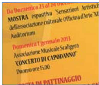
Sopra la locandina ufficiale del Natale con le date sbagliate