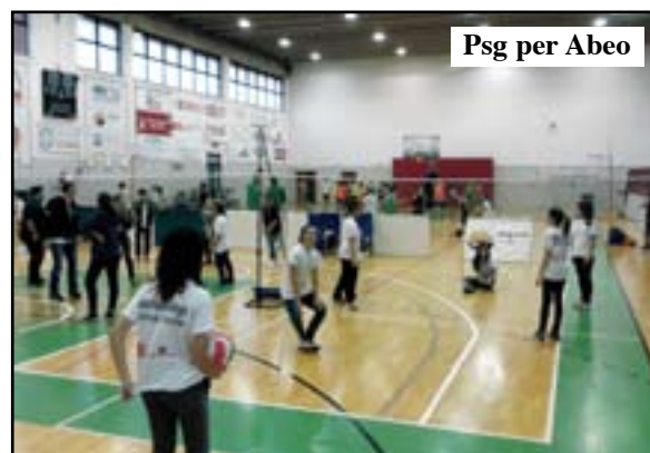
Psg per Abeo