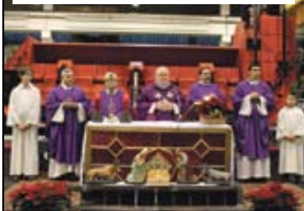
La celebrazione del Vescovo Zenti