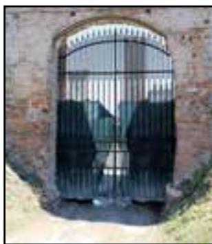
Il cancello del Castello col telone sbrindellato prima che fosse sostituito dopo mesi e ora "barricato"

gnalazioni dei cittadini sono ripetute. Tra la Biblioteca comunale e la sala Ferrarini i letamai colpiscono duro e l'angolo dove ci sono i contenitori dei rifiuti è diventato un ricettacolo di ogni immondizia senza regola. Se non passassero a pulire quelli dell'ape verde a quest'ora ci sarebbero le montagne peggio che a Napoli o a Roma. Quello che è triste è che la zona dovrebbe essere la cittadella della cultura, ed invece è diventata quella dei rifiuti.