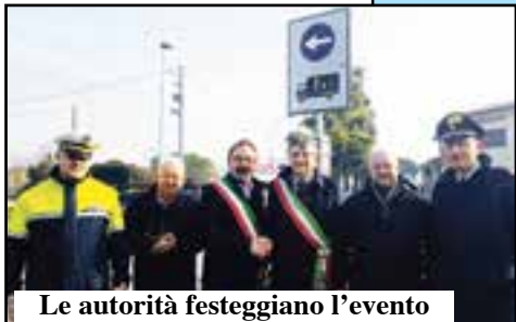
Le autorità festeggiano l'evento