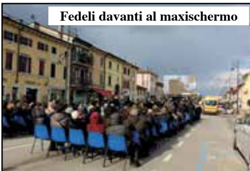
Fedeli davanti al maxischermo