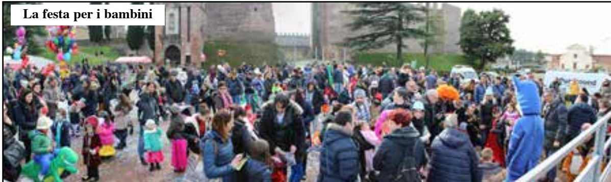
La festa per i bambini