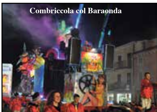
Combriccola col Baraonda

Il bilancio. Bilancio soddisfacente per il Comune che ha organizzato insieme al Circolo dei Folli. «Una serata tremenda sotto il profilo climatico che