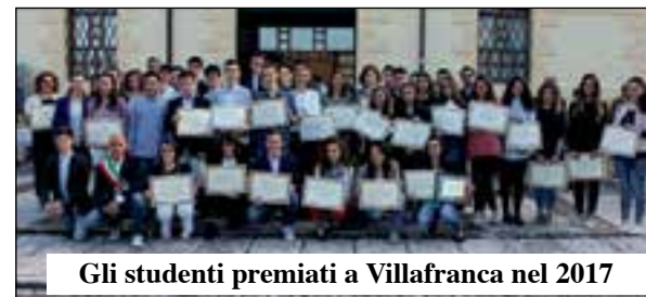
Gli studenti premiati a Villafranca nel 2017

stato) andranno ai laureati con laurea triennale (110/110 e lode), quadriennale, quinquennale (specialistica, con 110) residenti in Villafranca. Premi in denaro andranno ai laureati (residenti e non) con tesi su Villafranca e/o su Villafranca e il suo territorio. Il periodo è dall'1/10/2016 al 30/09/2017.