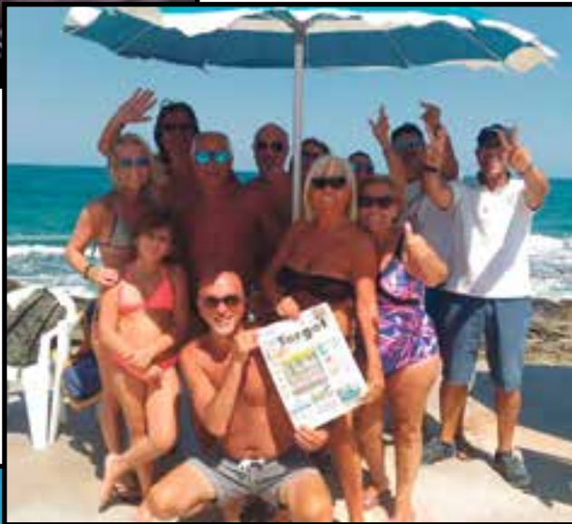
Le foto dell'allegria compagnia in vacanza in Puglia, a Torre a Mare (Ba)

ATTENZIONE Scrivete sempre un recapito telefonico. Altrimenti non potrete essere selezionati per le premiazioni