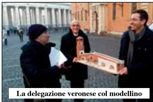
La delegazione veronese col modellino

con cui, a firma mons. Paolo Borgia, il Santo Padre accoglie con particolare affetto l'omaggio di un modellino, ripro-