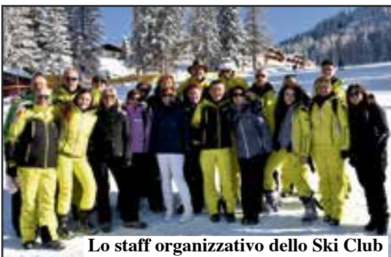
Lo staff organizzativo dello Ski Club