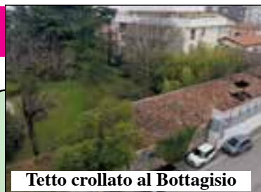
Tetto crollato al Bottagisio

Il Comune rientra nei tre progetti scelti dalla Regione e così si porta a casa oltre 4,5 milioni di euro di finanziamento