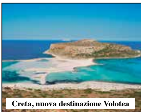
Crete, nuova destinazione Volotea

Il 2018 è iniziato con un altro exploit dell'aeroporto Catullo che nel mese di gennaio ha movimentato oltre 192.000 passeggeri, con un incremento del 7,7% rispetto allo stesso periodo dell'anno precedente.