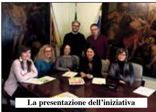
La presentazione dell'iniziativa

L'assessore alle Politiche Sociali e per la Famiglia e quello alle Politiche Giovanili ripropongono al "Centro Anck'io" il ciclo di incontri del progetto "C'è + di quello che vedi, aperitivi creativi per scoprire nuovi modi di stare bene con se stesse" giunto alla terza edizione.