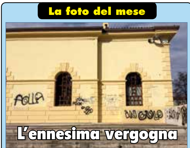
La foto del mese

Naturalmente subito sono fioccate le supposizioni dei cittadini sui motivi che hanno portato a questo. La più bella è che, evidentemente, degli spiraagli rimanevano comunque e così uno poteva