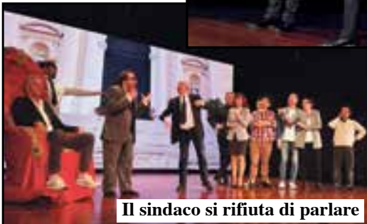
Il sindaco si rifiuta di parlare