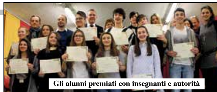
Gli alunni premiati con insegnanti e autorità