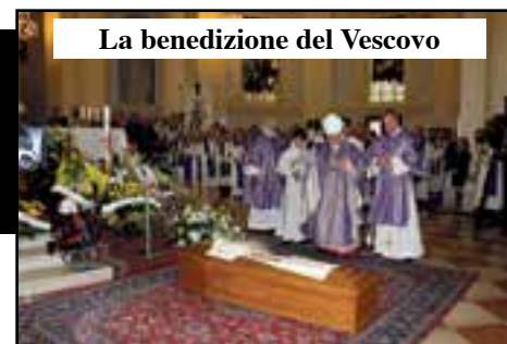
La benedizione del Vescovo

Ma è stato il Vescovo Giuseppe Zenti a inquadarlo alla perfezione con un breve ma particolarmente significativo ricordo. «Ha incarnato la figura del buon pastore, che sta col suo gregge, porta sulle spalle i più deboli, indica la