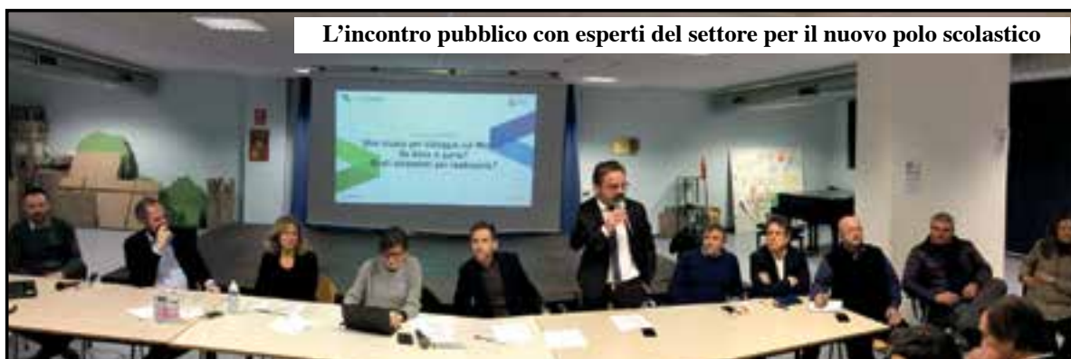
L'incontro pubblico con esperti del settore per il nuovo polo scolastico

«Dopo anni di impegno per rispondere ad esigenze puntuali di emergenza, ricavando nuove aule o dotando le scuole di servizi tecnologici in linea con le esigenze della didattica, la nostra Amministrazione