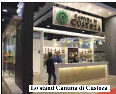
Lo stand Cantina di Custoza

Tutto il mondo guardava a Vinitaly e la risposta è stata positiva. Da Verona è uscito un messaggio incoraggiante con l'immagine di un'Italia economica ed organizzativa che funziona. Il vino è più che mai trainante e Vinitaly ha richiamato operatori professionali da 140 Paesi, ben 20 in più rispetto al 2014. In totale i visitatori sono stati circa 150mila, ma rispetto al passato c'è più Far East,