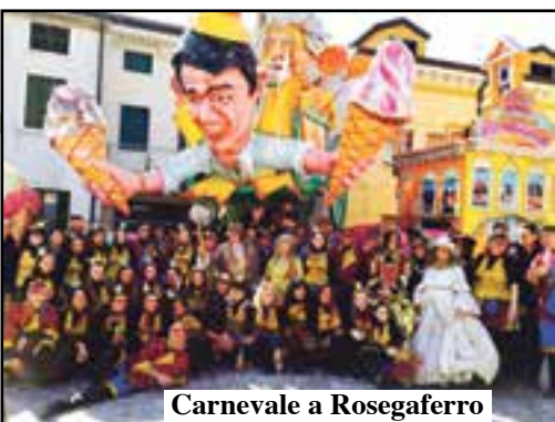
Carnevale a Rosegaferra

ito un tavolo di coordinamento interistituzionale con gli altri Comuni e tutte le Autorità del territorio al fine di affrontare il problema garantendo, per quanto possibile, una maggiore presenza delle Forze dell'Ordine.