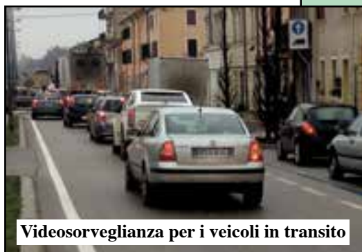
Videosorveglianza per i veicoli in transito

Il Comune corre ai ripari per frenare l'ondata di furti e danneggiamenti. Controllo sui veicoli