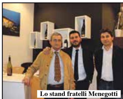
Lo stand fratelli Menegotti

ternazionale per togliere pressione al mercato interno che negli ultimi anni è stato un po' in sofferenza. Col 30% di aumento all'ingrosso e il 10% in meno di produzione, si va verso una situazione di equilibrio nelle cantine. I produttori stanno lavorando meglio e credono di più nel loro prodotto».