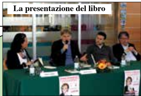
La presentazione del libro

Il nuovo Cda va verso la rinuncia al vecchio progetto ma impegna 210 mila euro per interventi urgenti di ristrutturazione