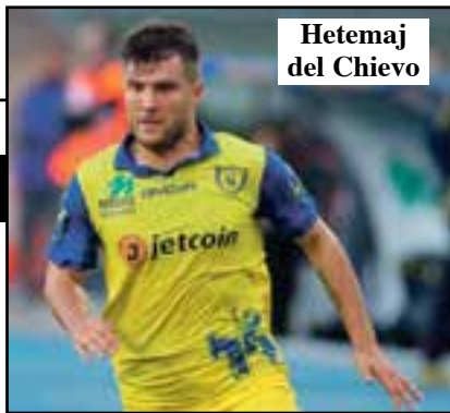
Hetemaj del Chievo