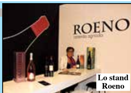
Lo stand Roeno

«I grandi mercati di Usa e Canada da soli rappresentano il 20% degli oltre 55mila visitatori esteri - ha detto il direttore generale Giovanni Mantovani -. L'area di lingua tedesca, Germania, Svizzera e Austria, si conferma la più importante con il 25% delle presenze, il Regno Unito è al terzo posto con il 10%, seguono in termini numerici i buyers dei Paesi Scandinavi e quelli del Benelux».