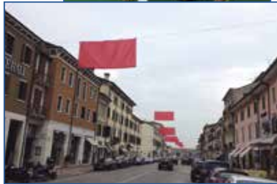
Gli striscioni e, in alto, la bella panchina deturpata allestita da Villafranca Shopping

mercianti di Villafranca Shopping insieme al Comune. Diciamo che è stata una sorta di rodaggio. Si è tentato di illuminare il Castello di rosso ma senza grossi risultati: pellicole colorate sbagliate e poi la corrente che saltava. Si è appeso il grande cuore ed è arrivato il nient della Soprintendenza. Gli stendardi rossi sono stati appesi dal Comune oltre la metà del mese e quelli in corso Garibaldi e via Pace non erano né carne, né pesce. Tanto che la gente si è interrogata sul loro significato e la più bella spiegazione è stata questa: «Ma li hanno messi per segnalare i fili quando passano i carri di Carnevale?». Naturalmente non erano neanche sul percorso ma questo dà l'idea dello sconcerto. Ma l'esperienza insegna e le decorazioni gialle di marzo hanno mostrato un deciso passo in avanti. Bene così.