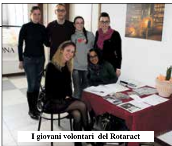
I giovani volontari del Rotaract

Grazie ad Ant e Rotaract, 40 visite dermatologiche nella giornata di prevenzione contro il melanoma