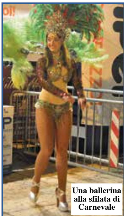
Una ballerina alla sfilata di Carnevale

STRAFALCIONI 1 - E' stato un vero Carnevale di strafalcioni. Sull'Arena si parla della sfilata e si legge: «Sfilata notturna aperta dal gruppo brasiliano "I piumaggi"». Poi: «Le ballerine del gruppo Forteza di Rio De Janeiro hanno aperto il carnevale 2015 di Villafranca». E nella didascalia compare «Una ballerina brasiliana del gruppo "Fortaleza" di Rio de Janeiro». Ma quante ne hanno scritte!!! In realtà poi