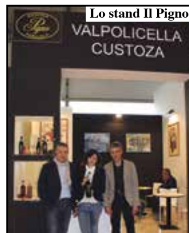
Lo stand Il Pigno

allontana dai vini barricati verso un vino piacevole ed equilibrato, che tra l'altro non è facile da produrre. La linea di tenden-