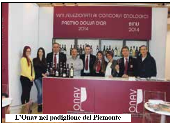
L'Onav nel padiglione del Piemonte