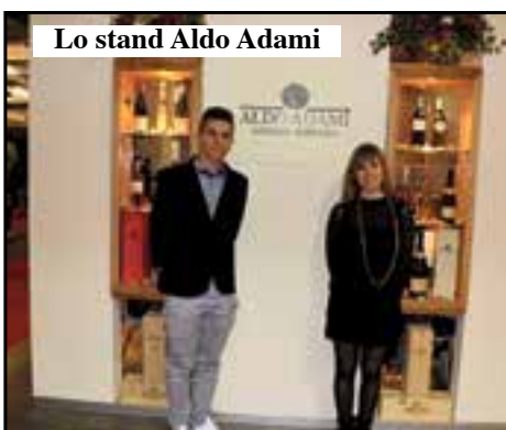
Lo stand Aldo Adami