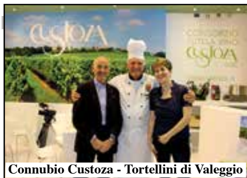
Connubio Custoza - Tortellini di Valeggio