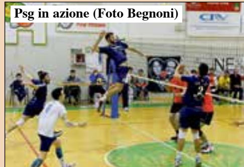
Psg in azione

Nel campionato di serie B2 maschile la Psg Volley Museo Nicolis Villafranca si gioca tutto in una settimana. Prima i gialloverdi affronteranno lo scontro diretto