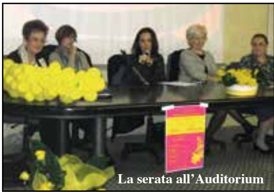
La serata all'Auditorium

«L'impegno che le donne mettono nelle istituzioni non è solo valido sotto il profilo tecnico ma anche umano perché ci mettono il cuore». E' questo il messaggio lanciato dalla tavola rotonda "Donne e istituzioni" organizzata dal Comitato della Biblioteca in collaborazione col