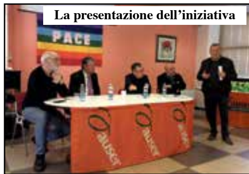
La presentazione dell'iniziativa