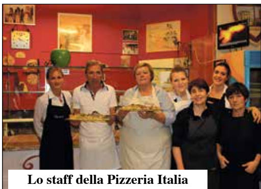
Lo staff della Pizzeria Italia

Continua il festival della tagliatella con la rassegna promossa al Giovedì da Comune e Associazione Ristoratori di Villafranca. Ancora 4 serate fino al 18 maggio.