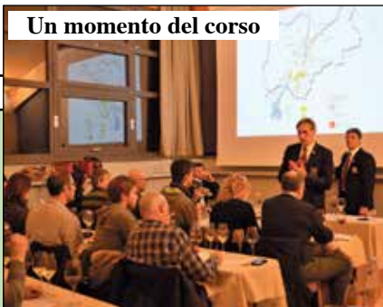
Un momento del corso

Quest'anno i ristoratori di Villafranca si sono sbizzarriti nel proporre il piatto tipico in tanti modi diversi