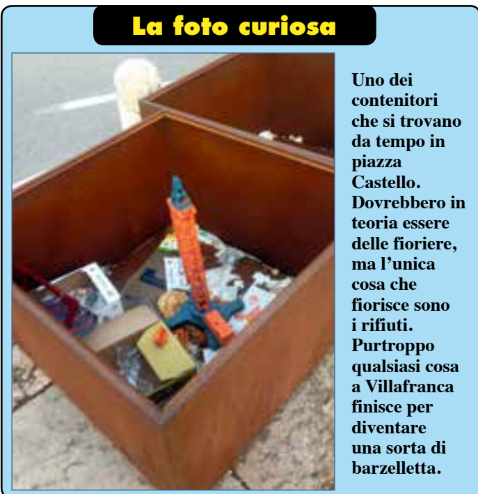
La foto curiosa

1 - Ci siamo appena lasciati alle spalle il Carnevale che Villafranca ha vissuto intensamente con la grande sfilata in notturna. Ma il sito ufficiale del Comune di Villafranca ci regala sul tema uno strafalcione da record: «Villafranca ha le proprie maschere, il Castellano e la Regina Sfoiadina, che ricordano il monumento simbolo del paese e il suo dolce caratteristico che vengono presentate alla cittadinanza l'ultima domenica di carnevale in occasione della "gnocolada". Al martedì, ultimo giorno di carnevale, l'imponente sfilata di carri allegorici per le vie cittadine con premiazione delle maschere». Ma quante fanfaluche hanno scritto?! L'ultima domenica