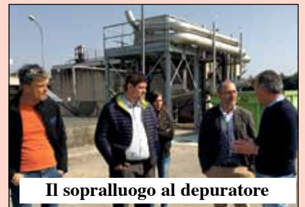
Il sopralluogo al depuratore

«L'obiettivo è quello di ridurre gli impatti ambientali, migliorando l'efficienza dell'impianto per ottenere spese gestionali più sostenibili - ha sottolineato Cordioli -. I costi dell'intervento ammontano a 707 mila euro. Nel 2016 avevamo provveduto a potenziare il collettore di adduzione dello stesso depuratore (l'intervento era costato 1.750.000 euro). La nostra società è impegnata a garantire una costante armonia tra sviluppo delle infrastrutture ed esigenze ambientali e della collettività».