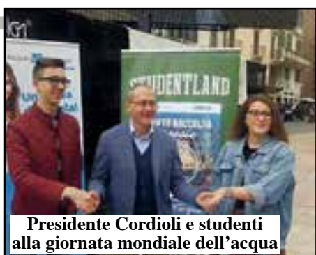
Presidente Cordioli e studenti alla giornata mondiale dell'acqua

In occasione della Giornata Mondiale dell'Acqua è stato organizzato in piazza Erbe da Acque Veronesi, insieme all'Amministrazione comunale e Legambiente, un momento di sensibilizzazione sull'uso consapevole dell'acqua, una risorsa sempre più preziosa e da tutelare.