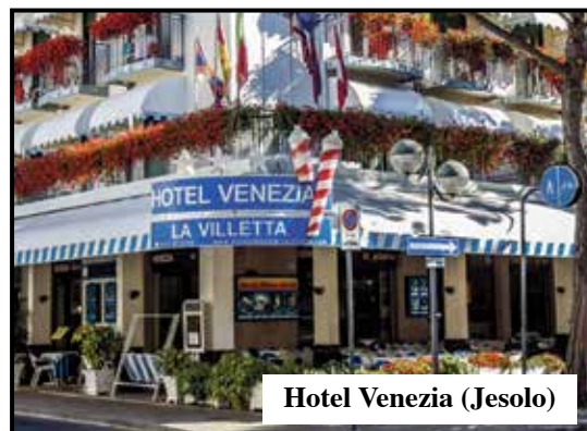
Hotel Venezia (Jesolo)

CONDIZIONI PER LA PARTECIPAZIONE: AVER COMPIUTO 60 ANNI AUTOSUFFICIENZA I NON RESIDENTI VERRANNO AMMESSI SOLO IN CASO DI DISPONIBILITÀ