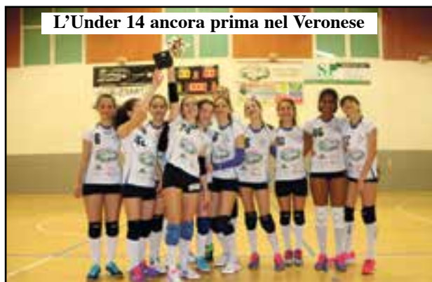
L'Under 14 ancora prima nel Veronese