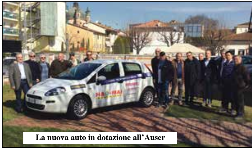
La nuova auto in dotazione all'Auser

Un'altra auto per il sempre più richiesto servizio Stacco a favore degli anziani