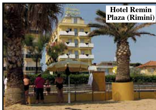
Hotel Remin Plaza (Rimini)