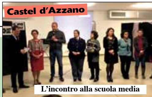
L'incontro alla scuola media

Comune e Pro Civ hanno sottoscritto una nuova convenzione triennale che dà continuità al lavoro svolto in questi anni