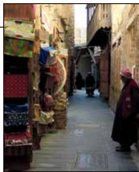
Nelle foto i contrasti di Doha: città storica e moderna, tra mare e deserto