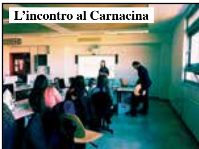
L'incontro al Carnacina