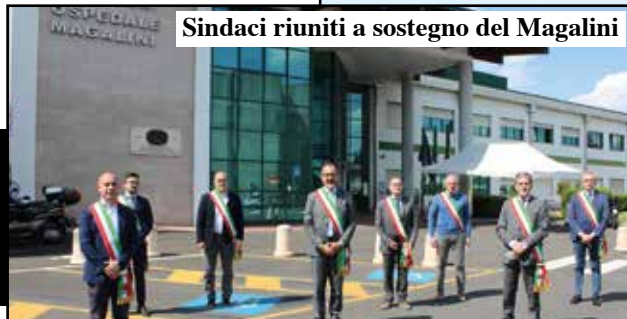
Sindaci riuniti a sostegno del Magalini