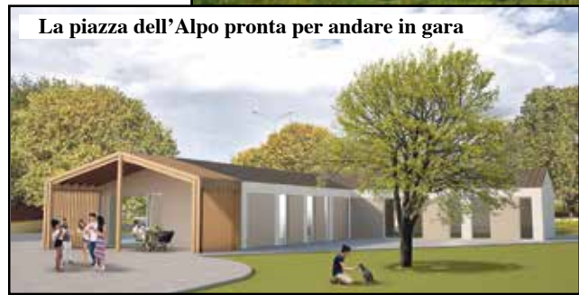
La piazza dell'Alpo pronta per andare in gara