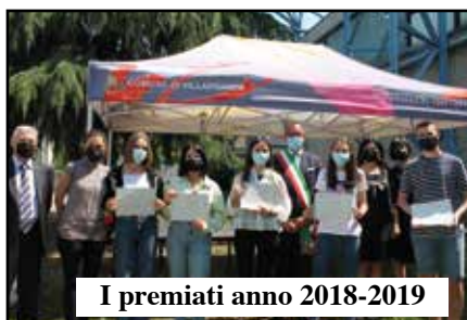
I premiati anno 2018-2019