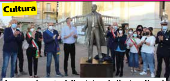
Lo scoprimento della statua dedicata a Rensi

Dopo la dura lotta al virus, aperti il Pronto Soccorso e i reparti. Novità per il futuro