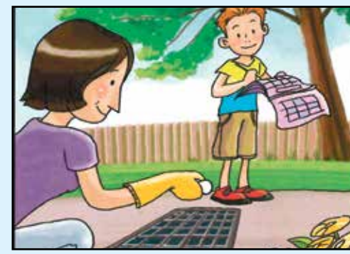
TRATTA I TOMBINI CON PASTIGLIE DI INSETTICIDA DA APRILE A SETTEMBRE