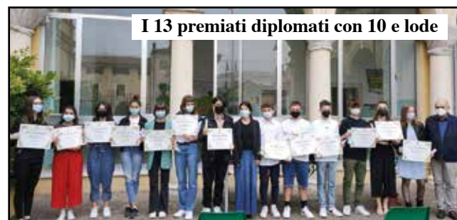
I 13 premiati diplomati con 10 e lode