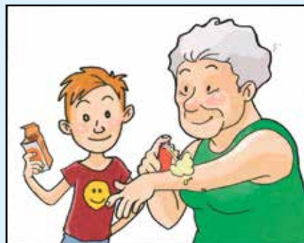
USA PURE I REPELLENTI CUTANEI MA SOLO IN CASO DI NECESSITA'

Dal momento che non è pensabile di sterminare le zanzare, è opportuno imparare a proteggersi in modo adeguato quando si va all'esterno (giardino, orto, manifestazioni, eventi sportivi, ecc.). Utilizzare zampironi e repellenti personali è un valido sistema per evitare di essere punti, per adulti, bambini e anziani. Per l'utilizzo di repellenti seguire attentamente le istruzioni d'uso riportate sulle confezioni.