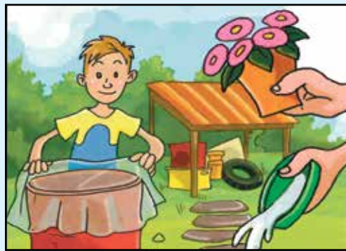
METTI AL RIPARO DALLA PIOGGIA TUTTO CIO' CHE PUO' RACCOLGERE L'ACQUA

Prevenire è sempre l'operazione fondamentale. Significa eliminare i potenziali focolai in cui si possono sviluppare le larve. E' un comportamento che non implica nessun costo e assicura buoni risultati