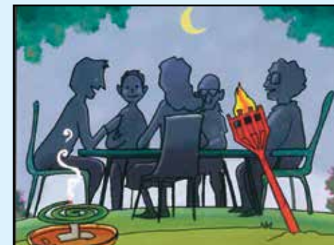
QUANDO SOGGIORNI ALL'APERTO PROTEGGITI CON REPELLENTI AMBIENTALI