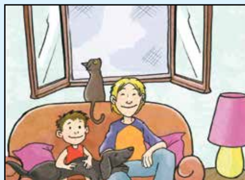
IN CASA INSTALLA LE ZANZARIERE ANZICHE' USARE ZAMPIRONI E FORNELLETTI

Se il ristagno d'acqua non può essere eliminato bisogna evitare che all'interno vengano deposte e si sviluppino le larve che poi diventeranno zanzare. Se si tratta di un laghetto per pesci, saranno questi a cibarsi delle larve. Se non c'è questa possibilità è opportuno utilizzare prodotti antilarvali biologici che evitano che la larva si sviluppi. Questa metodologia è sicura purché si rispettino le indicazioni riportate sulla scheda tecnica e sulle indicazioni d'uso del prodotto. I benefici si vedono sul medio termine ma, se il prodotto è correttamente applicato, sono più duraturi, poco costosi e non vi sono impatti su altre specie. Attenzione ai prodotti adulticidi, che danno un effetto immediato ma di breve durata. Sono da evitarsi perché non selettivi (uccidono qualsiasi specie di insetto) e di costo elevato.