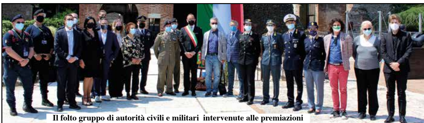
Il folto gruppo di autorità civili e militari intervenute alle premiazioni