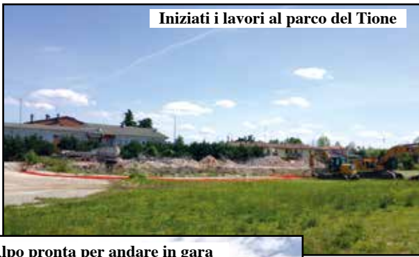
Iniziati i lavori al parco del Tione