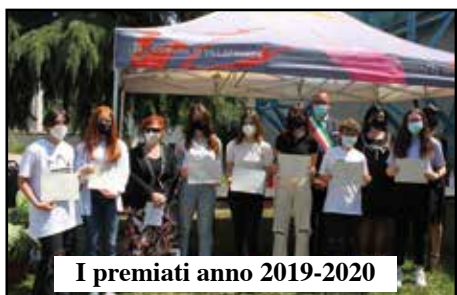
I premiati anno 2019-2020

La pandemia aveva fatto rinviare la tradizionale consegna delle borse di studio. Ma la Scuola Secondaria di 1° Levi -