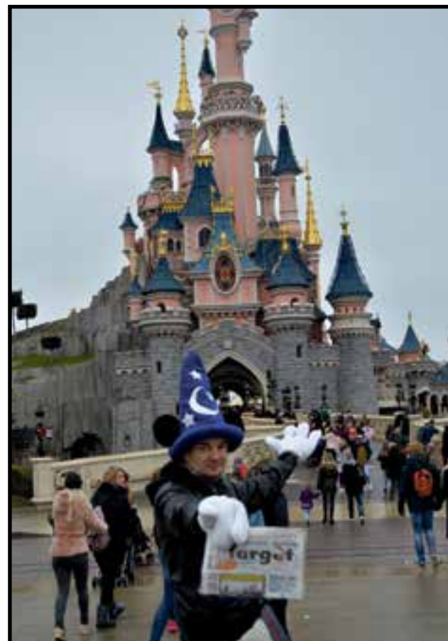
«Giusto un fine settimana in Francia per visitare i posti migliori: Parigi, Disneyland e Versailles. Bonjour a tutti gli amici di Target»