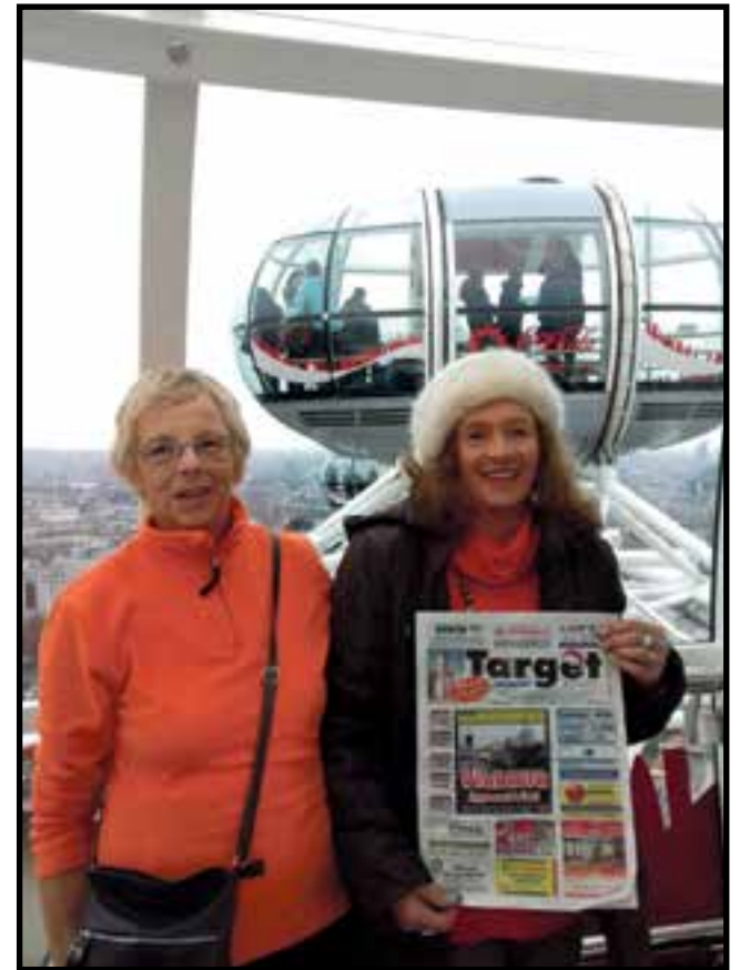
«Una vacanza trascorsa nella stupenda città di Londra in compagnia di amici: a sinistra davanti l'abbazia di Westminster, sopra davanti a Buckingham Palace e a destra su London Eye» (Inviata da Valeria Weirather)