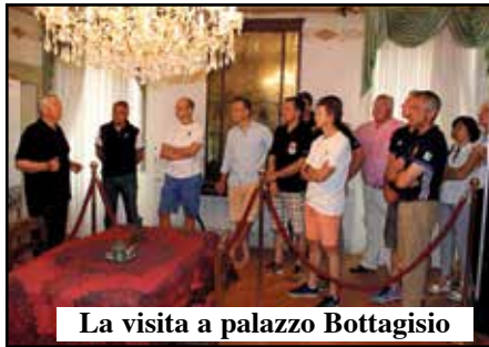
La visita a palazzo Bottagisio