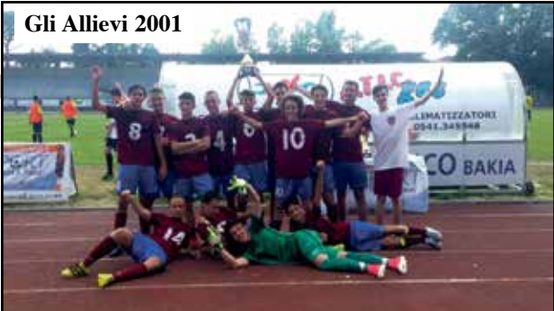
Gli Allievi 2001