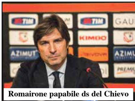
Romairone papabile ds del Chievo

Nuovo Ds per la squadra della Diga, l'Hellas cerca rinforzi