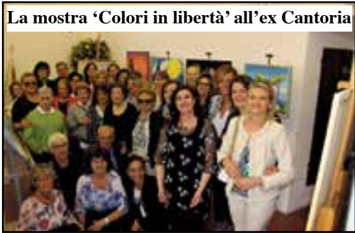
La mostra 'Colori in libertà' all'ex Cantoria