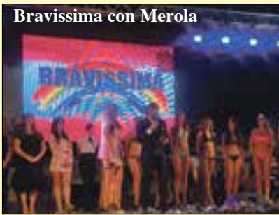
Bravissima con Merola

Due le mostre culturali. A palazzo Bottagisio dal 24 giugno al 3 luglio ci sarà l'e-