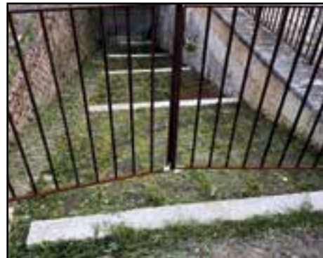
A sinistra lo strafalcione sul televideo che dà vincente Biella contro Tezenis prima ancora di giocare la partita. E poi ha vinto Verona. Al centro e a destra gli scivoli che scendono nel fossato ai lati del Castello, prima e dopo... la cura