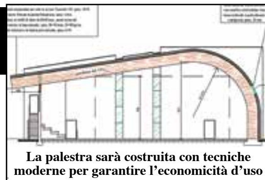
La palestra sarà costruita con tecniche moderne per garantire l'economicità d'uso

La palestra sarà strutturata per poter ospitare anche manifestazioni per sportivi diversamente abili.