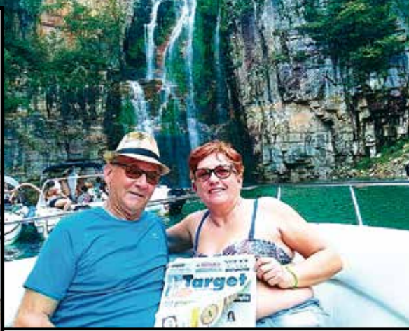
A sinistra Barra Grande nello stato del Piauí nel Nord del Brasile; sopra il più grande lago del Brasile, il lago Azul nell'area di Hinha Reais