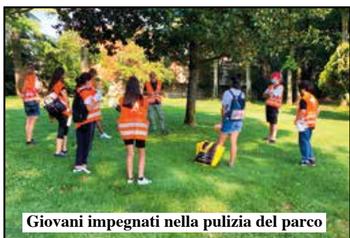
Giovani impegnati nella pulizia del parco

L'Amministrazione Comunale di Povegliano ha aderito al Progetto "Ri-Generazione 2.2 - Zoom", un'iniziativa promossa dal Distretto 4 Ovest dell'Ulss 9 con 37 Comuni partner,