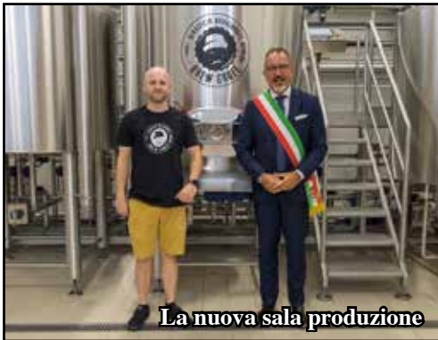
La nuova sala produzione