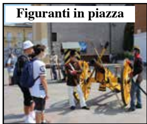
Figuranti in piazza

si concludevano nella sala del Trattato. Chi si è recato al mercatino dell'Antiquariato, invece, ha potuto incontrare tra le bancarelle i rievocatori storici che hanno animato le vie del centro.