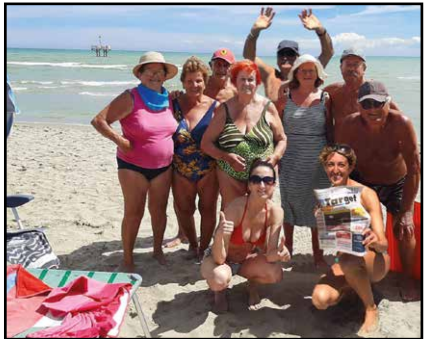
«Dopo tante chiusure finalmente un po' di relax al mare».