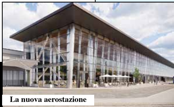
La nuova aerostazione

Partiti i lavori per 68 milioni che finiranno nel 2024