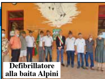
Defibrillatore alla baita Alpini