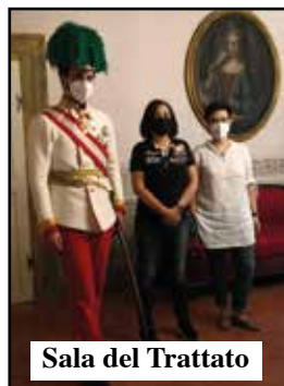
Sala del Trattato