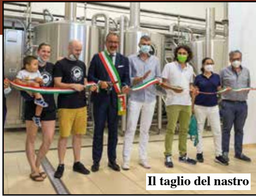
Il taglio del nastro