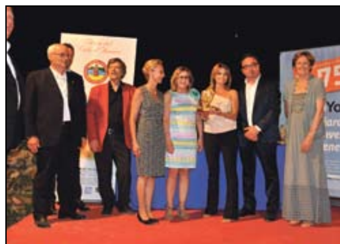
Il momento della consegna dei riconoscimenti

Vent'anni del Nodo d'amore festeggiati al meglio. Lo spettacolo pirotecnico con i fuochi sparati per la prima volta non solo dal castello ma anche dal parco Sigurtà, ha