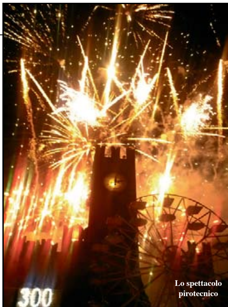
Lo spettacolo pirotecnico

La rassegna dei santi Pietro e Paolo ha raggiunto i tre secoli di storia. Rispetto all'edizione del 2012 i visitatori sono aumentati ma resta sempre inferiore la capacità di spesa rispetto al passato sia da parte di chi organizza, sia di coloro che vengono a Villafranca nei giorni di sagra. Soffrono le proposte commerciali, bene i fuochi artificiali