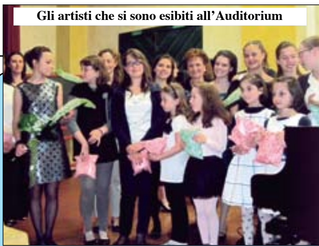
Gli artisti che si sono esibiti all'Auditorium

Al concorso provinciale dei carri allegorici i nostri gruppi hanno fatto il pieno di premi