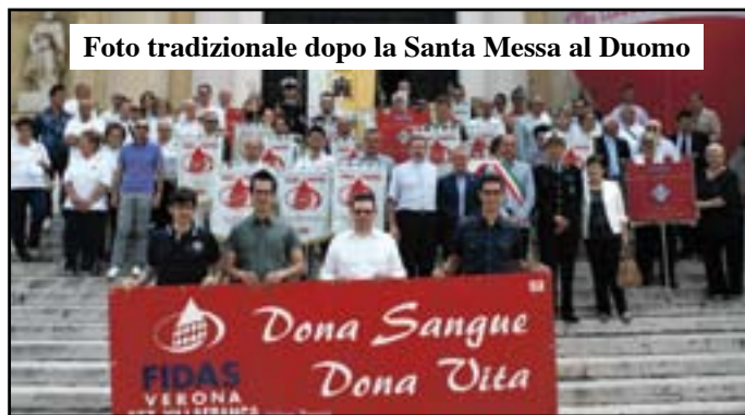
Foto tradizionale dopo la Santa Messa al Duomo