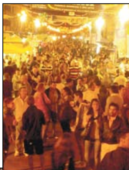
più gente dello scorso anno».