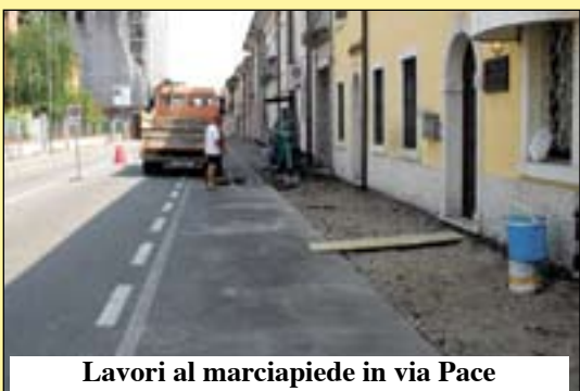
Lavori al marciapiede in via Pace

Dopo quelli in via Fantoni e via san Francesco, si sta procedendo alla riqualificazione del marciapiede disastroso in via Pace.