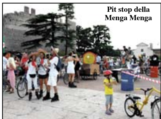
Pit stop della Menga Menga