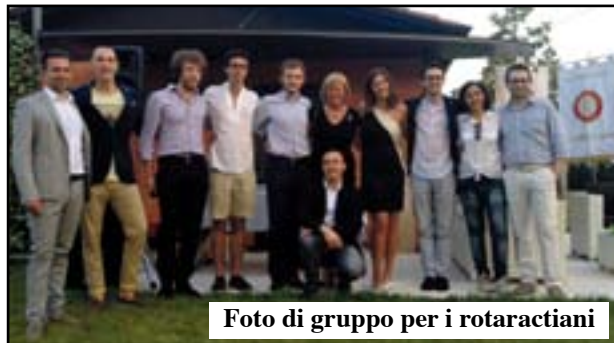
Foto di gruppo per i rotaractiani

- Ringrazio tutti perché in questo biennio sono state realizzate molte iniziative atte a valorizzare il territorio. In particolare vorrei ricordare la collaborazione con l'Associazione Nazionale Tumori, che offre assistenza gratuita ai malati terminali. In sin-