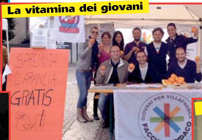
I giovani di Faccioli hanno regalato arance, vitamina per il voto