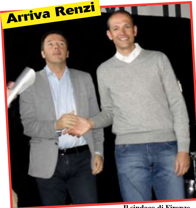
Il sindaco di Firenze Matteo Renzi intervenuto a sostegno di Paolo Martari