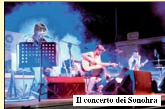
Il concerto dei Sonohra

L'aspetto che più ha soddisfatto della Fiera dei santi Pietro e Paolo è stato quello degli spettacoli proposti in due location: piazza Giovanni XXIII e piazza Villafranchetta.