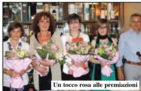
Un tocco rosa alle premiazioni