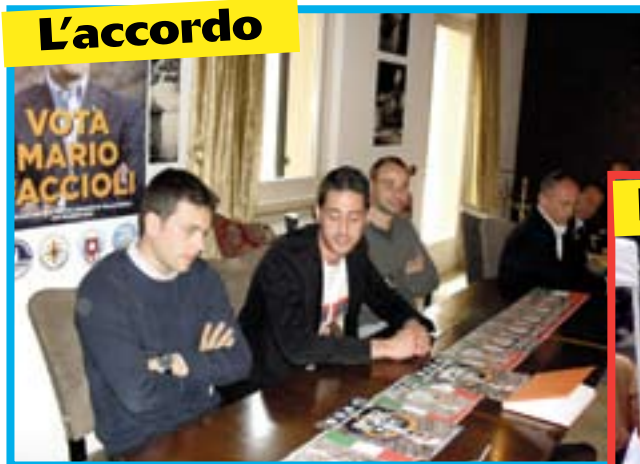
L'accordo con Rinnoviamo Villafranca