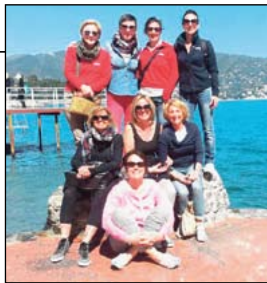
Ecco le amiche del "Gruppo in fuga". Con la loro crociera hanno visitato Barcellona e Marsiglia, un po' di Liguria e anche preso un po' di sole

negliano, patria di Cima, quindi il medievale castello di Roganzuolo, che conserva opere di Tiziano. Proseguendo si giunge a Colle Umberto dove Tiziano si costruì la casa, oggi villa Fabris; quindi Vittorio Veneto dove a Palazzo Sarcinelli si sposò Lavinia la figlia del pittore. Lasciando alle spalle i profumi del Conegliano Valdobbiadene Prosecco Superiore l'itinerario si chiude a Pieve di Cadore, la città che ha dato i natali a Tiziano e dove c'è la mostra. (fino al 6 ottobre, Palazzo Cosmo; orario: 10-19, info 0435.501674)