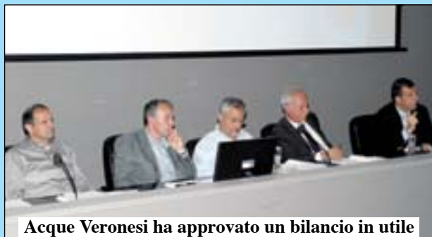
Acque Veronesi ha approvato un bilancio in utile