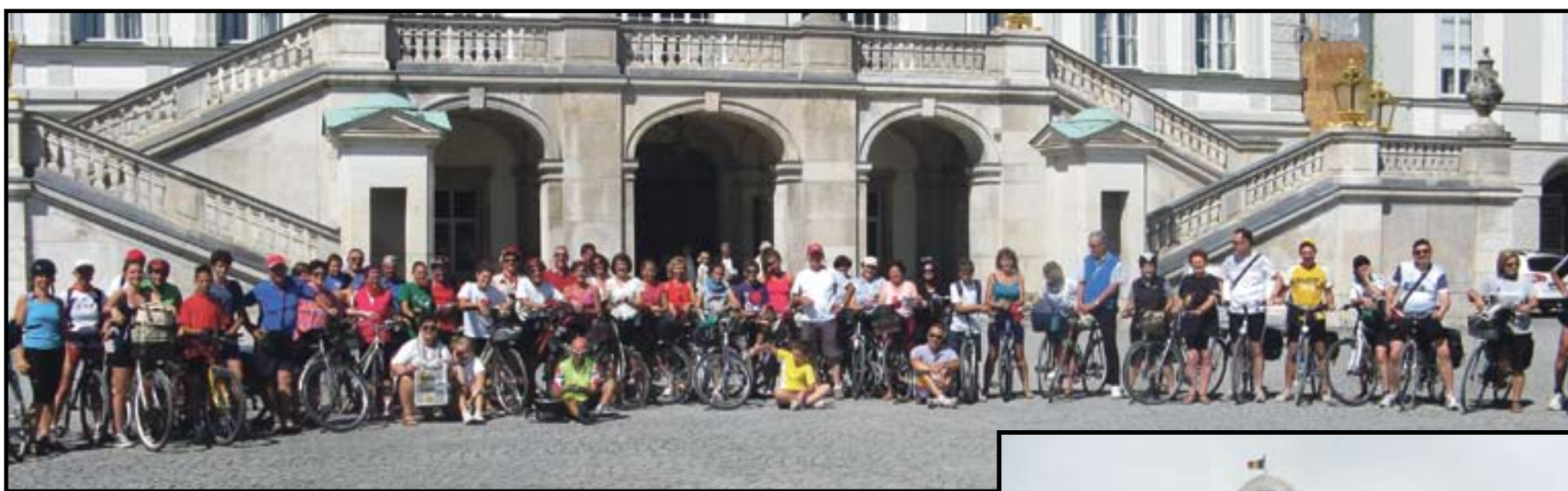
Un'immagine del tour della parrocchia di Povegliano Veronese a Monaco di Baviera.