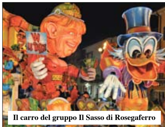
Il carro del gruppo Il Sasso di Rosegaferro