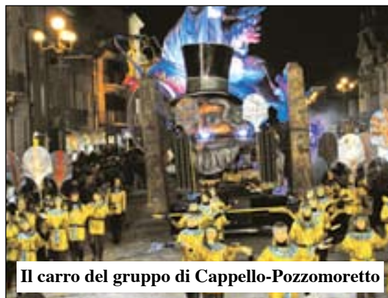
Il carro del gruppo di Cappello-Pozzomoretto

Il trofeo del Gran Bacanal del Gnoco resta in casa. Il concorso provinciale per i carri allegorici del Carnevale ha visto ancora una volta prevalere, alle premiazioni di Peshiera, il gruppo Cappello - Pozzomoretto davanti ai rivali storici di Rosegaferro. Quarto posto per l'Alpo dietro Oppeano.