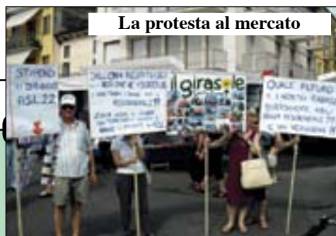
La protesta al mercato

Villafranca sarà l'ospedale di riferimento del Sud Ovest veronese in base alle nuove schede regionali. Sarà la gamba più forte del polo con Bussolengo