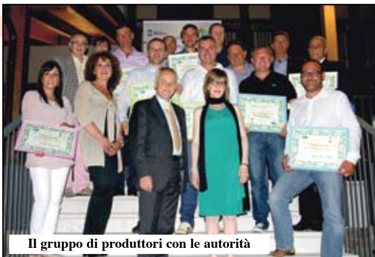
Il gruppo di produttori con le autorità

Premiazioni al Picoverde di Custoza, per il 42° Concorso del Custoza, uno dei primi nati in Italia, che è stato ulteriormente aggiornato nel contenuto, nel sistema di valutazione e nel Regolamento, con il consenso del Ministero delle Politiche Agricole e Forestali che ha approvato le modifiche. Il Concorso, organizzato dalla Pro Loco di Custoza in collaborazione con la Strada del Vino Bianco, ha visto la selezione effettuata dalle commissioni composte da enologi, tecnici, assaggiatori Onav e sommelier Ais. E' stato mantenuto il punteggio minimo, introdotto nella precedente edizione, di 85 punti per il Custoza DOC 2012 e di 87 punti per il Custoza Superiore 2011, questo per mantenere alta la competizione ed il livello