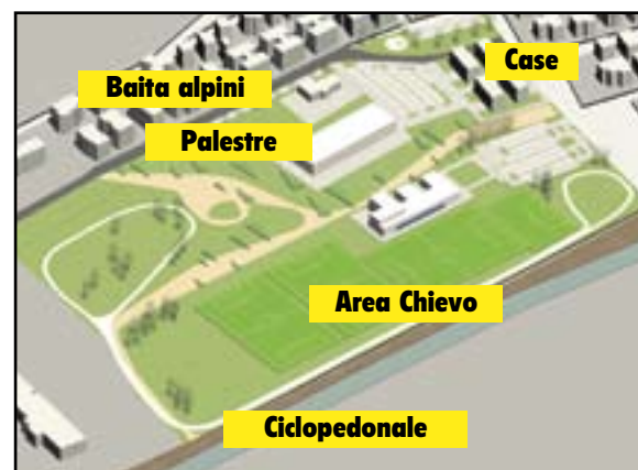
Il progetto Parco del Tione Cittadella dello Sport