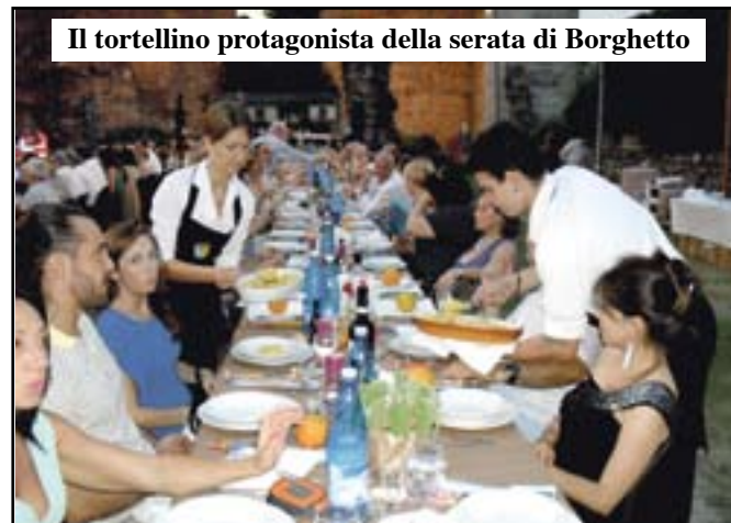
Il tortellino protagonista della serata di Borghetto

Tutti soddisfatti alla cena sul Ponte: dall'Associazione dei Ristoratori di Valeggio ai circa 3300 commensali