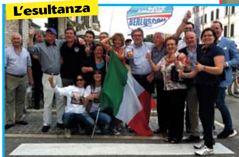
La festa davanti al municipio dopo i risultati finali