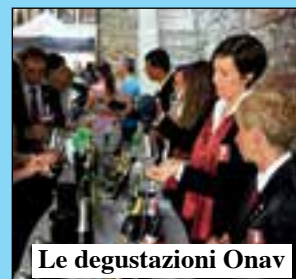
Le degustazioni Onav

Tra le conferme della Fiera, la 17ª rassegna enologica interprovinciale "Città di Villafranca", dedicata a spumanti e frizzanti dell'Onav.