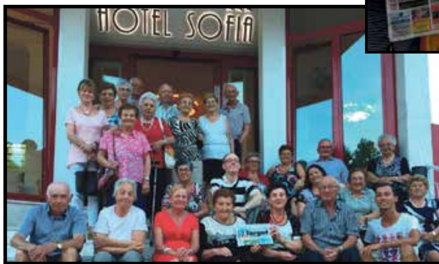
«Jesolo, dove le vacanze organizzate dal Comune diventano l'appuntamento annuale per condividere il riposo e l'allegria».

ATTENZIONE Se spedite le foto via posta o le portate a mano scrivete sempre un recapito telefonico. Altrimenti non potrete essere selezionati per le premiazioni