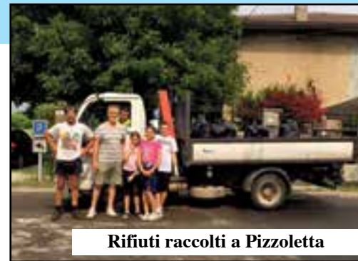
Rifiuti raccolti a Pizzoletta