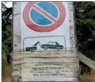
I cartelli di rimozione forzata "rinvenuti" dopo mesi dalla scadenza della data riportata

DIVIETI 1 - Abbiamo oramai visto di tutto, tra cartelli di divieti improbabili e ordinanze disattese. Ma