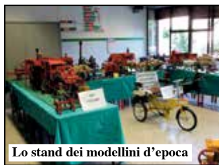
Lo stand dei modellini d'epoca

Oltre alle premiazioni dei ragazzi per i mattoncini, sono state consegnate due targhe a Pietro Recchia e Gino Gambarin per i modellini di macchine agricole e veicoli d'epoca con tanto di movimenti.