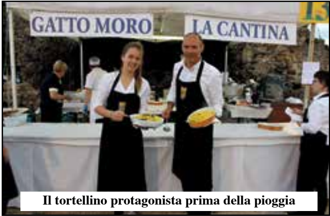
Il tortellino protagonista prima della pioggia

L'Associazione Ristoratori Valeggio ha mostrato di essere unita e di poter far fronte ad ogni tipo di avversità