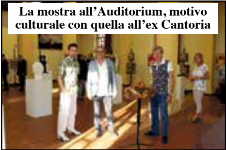
La mostra all'Auditorium, motivo culturale con quella all'ex Cantoria