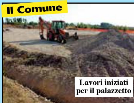
Lavori iniziati per il palazzetto