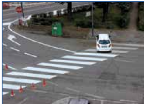
A sinistra la segnaletica incompleta a causa di un parcheggio fuori posto. A destra il segnale capovolto alla rotonda del Catullo.