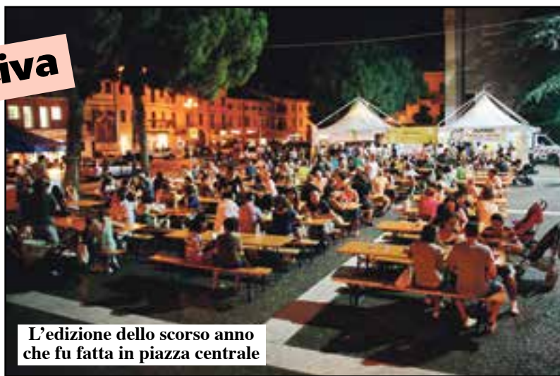
L'edizione dello scorso anno che fu fatta in piazza centrale

Dal 17 al 19 luglio due mega tavolate su corso Vittorio Emanuele