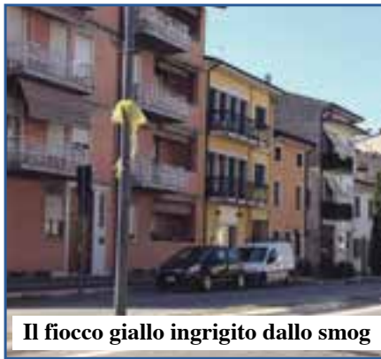
Il fiocco giallo ingrignito dallo smog

a volte viene veramente da sorridere a leggere certe prescrizioni. In occasione della corsa ciclistica pre-feristica, infatti, nell'ordinanza c'era scritto al punto 4: «Divieto di attraversamento da parte dei pedoni della carreggiata al momento del passaggio dei ciclisti partecipanti alla competizione sportiva». E ghe mancarà altro!