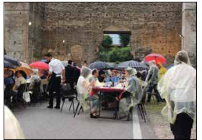
Il maltempo non ha fatto scappare gli oltre 3 mila ospiti