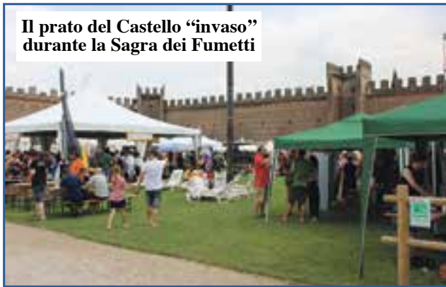
Il prato del Castello "invaso" durante la Sagra dei Fumetti

1 - Certe volte il rifacimento della segnaletica è veramente divertente. Come si vede nella foto, sono state rifatte le strisce per l'attraversamento pedonale ma ne manca un pezzo. Motivo? Quando sono passati gli addetti c'era