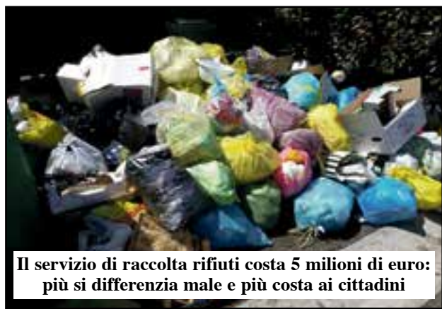
Il servizio di raccolta rifiuti costa 5 milioni di euro: più si differenzia male e più costa ai cittadini

Entrate extratributarie. Ammontano complessivamente a circa 7.500.000 euro. Le voci più rilevanti riguardano proventi dai diritti (200.000), Servizio