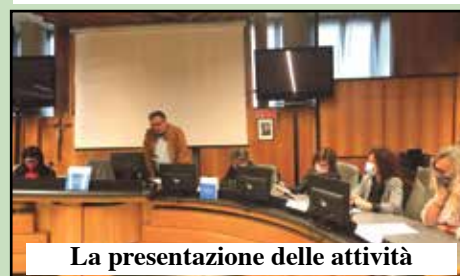
La presentazione delle attività