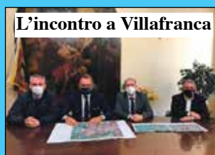
L'incontro a Villafranca

Si farà un referendum per portare La Rizza sotto un unico Comune. Attualmente il territorio, 2500 abitanti, è suddiviso tra Villa-