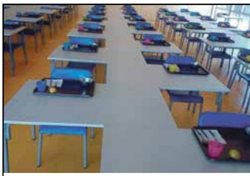
Banchi, ecco come usare quelli normali

mila euro l'anno, con un decreto firmato dai ministri del Lavoro Nunzia Catalfo e del Tesoro Roberto Gualtieri. E il premier Conte ha detto che è adeguato! Visto che l'Inps gestisce la cassa integrazione e in molti casi ancora non è stata erogata non ci sono commenti pubblicabili. Si possono facilmente capire i vaffa: era il grido di battaglia di chi ora ci governa e che, avendo tradito le promesse fatte agli elettori, ora se lo vede ritorcere contro.