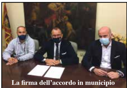
La firma dell'accordo in municipio

Per tutta la stagione opereranno in reciproca collaborazione, pur conservando ciascuna la propria autonomia sportiva ed economica.