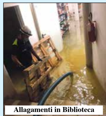
Allagamenti in Biblioteca

Il Consiglio comunale ha dato via libera coi voti della maggioranza all'utilizzo dell'avanzo disponibile applicato alla parte in conto capitale per euro 390.000 che serviranno per il finanziamento di numerosi interventi e opere.