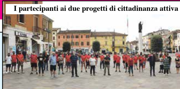
I partecipanti ai due progetti di cittadinanza attiva

Per i due progetti il Comune ha investito circa 12 mila euro.