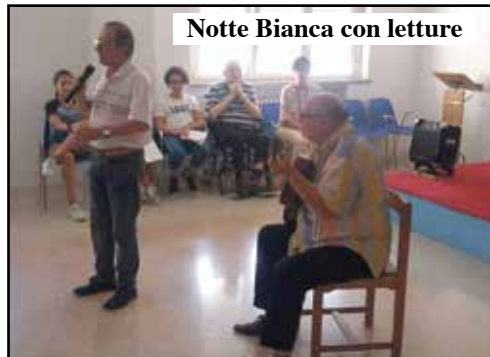
Notte Bianca con letture