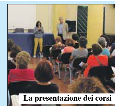
La presentazione dei corsi