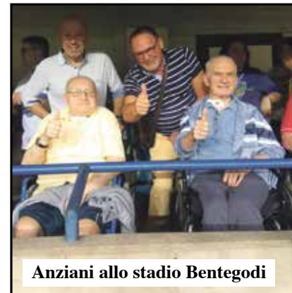
Anziani allo stadio Bentegodi

Attività ludico motoria. Da ottobre 2019 in collaborazione con Gymnasium palestra Villafranca. A cura di professionisti di Gymnasium pensata ad hoc per gli ospiti di Casa Riposo e/o Centro Diurno in coordinamento con i