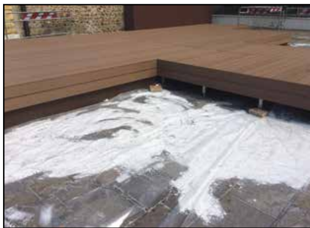
Lavori in piazza per togliere la cera sulle piastrelle