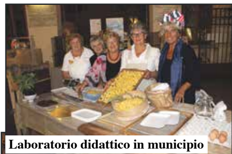
Laboratorio didattico in municipio