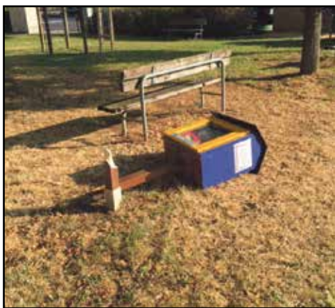
Il contenitore del Book Crossing che qualche fenomeno ha abbattuto nell'area verde di Alpo