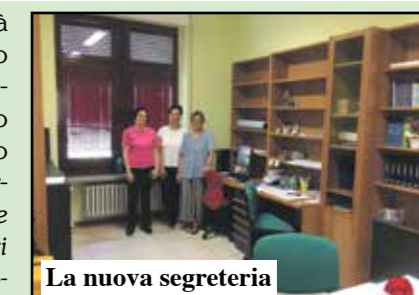
La nuova segreteria

Nuovi spazi e nuove iniziative alla medie paritarie Don Allegri. Anche quest'anno ci sono stati necessari dei lavori di ampliamento dovuti all'aumento del numero di studenti. Già l'anno scorso era partita una sezione in più che ha trovato continuità nelle iscrizioni di quest'anno, per un totale di 204 alunni. Dopo le tre settimane di attività di studio assistito organizzate dalla scuola, un nuovo anno è iniziato con delle novità. Innanzitutto il potenziamento musicale, che prevede lezioni individuali e collettive riguardanti canto moderno, chitarra elettrica, batteria, clarinetto, pianoforte e violino. Altro punto forte della scuola è il potenziamento della lingua inglese, con 5 ore settimanali di lezione, corsi pomeridiani con madrelingua, la possibilità di sostenere l'esame Trinity e lo stage in Inghilterra. Immane anche la gita sportiva a passo Oclini, dove i ragazzi possono cimentarsi nei vari sport invernali. «La scuola offre inoltre un'ampia scelta di laboratori extracurricolari e il doposcuola pomeridiano - sottolinea il preside Paolo Chiavico -. Una Don Allegri sempre in ascesa che cerca di stare al passo coi tempi rinnovandosi ogni anno». Per altre informazioni contattare la segreteria della scuola (Tel/Fax 045.6302774 - scuoladonallegri@gmail.com)