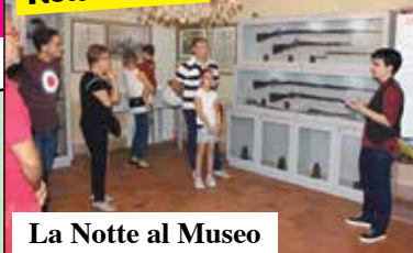
La Notte al Museo

Con l'ormai consueto rinvio è tornata a Villafranca la Notte Bianca, il giorno più lungo del calendario castellano.