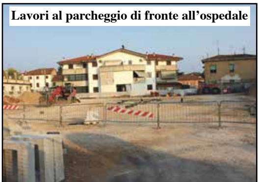
Lavori al parcheggio di fronte all'ospedale

siamo arrivati a settembre mentre il momento migliore era luglio e agosto quando c'è un fisiologico calo di utenze. Il Comune gestirà il parcheggio a pagamento col gettone come a Peschiera».