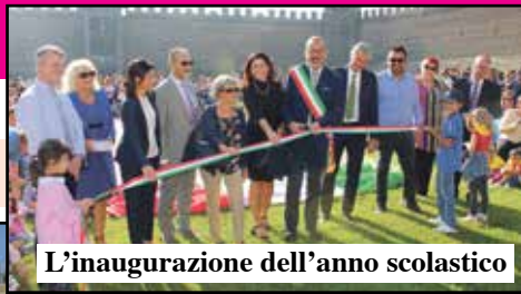
L'inaugurazione dell'anno scolastico