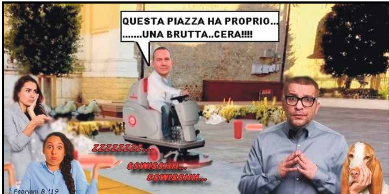
Ecco come Bruno Fabriani vede in chiave umoristica la vicenda tribolata della nuova pavimentazione di piazza Giovanni XXIII "sporcata" con la cera delle candele alla festa dei saldi dopo i liquidi versati durante il Natale