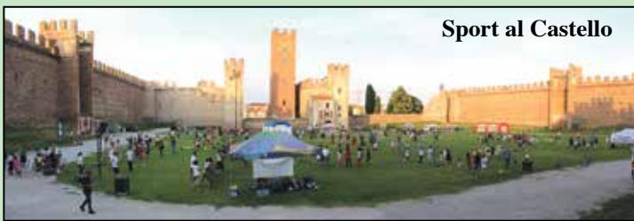
Sport al Castello

tà sportive per i ragazzi. Poi le tante attrattive in centro con un occhio particolare alle famiglie. Verso sera è stato aperto anche il Museo del Risorgimento con altre iniziative culturali in collaborazione con il Circolo dei lettori della Biblioteca come "Immagini