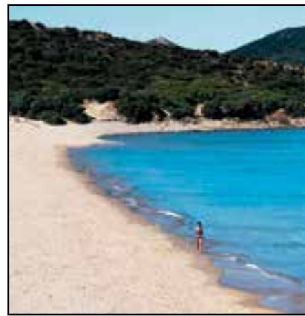
La spiaggia di Chia in Sardegna

Pompei stupisce mar, mer, ven e dom 9.30-19.30, gio e sab 9.30-22.30; info 02. 92800821) propone al pubblico vasi dipinti, terrecotte votive, statue, affreschi e oggetti di lusso come argenterie e monili aurei, ordinati dal VIII sec. a.C. al II sec. d.C. Un focus particolare viene dedicato ai reperti archeologici di area vesuviana con una selezione di capolavori di pittura parietale pompeiana. «Questa mostra ha un forte legame con Expo e i suoi temi perché mette in luce l'influenza della natura sulla civiltà occidentale e sulle sue origini».