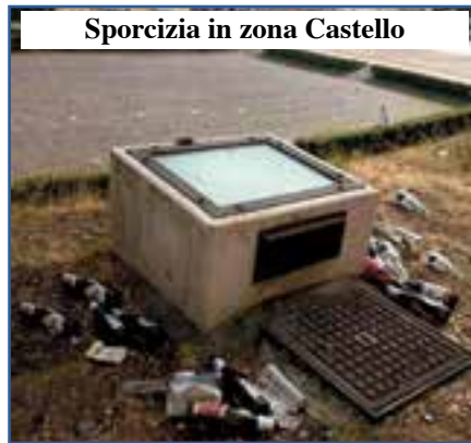
Sporcizia in zona Castello