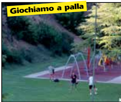
Giochiamo a palla