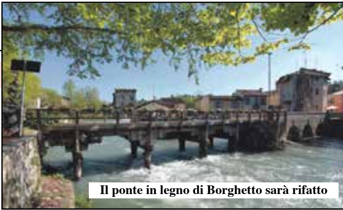
Il ponte in legno di Borghetto sarà rifatto

La struttura fortemente lesionata dalle infiltrazioni d'acqua