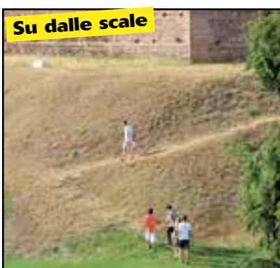
Su dalle scale