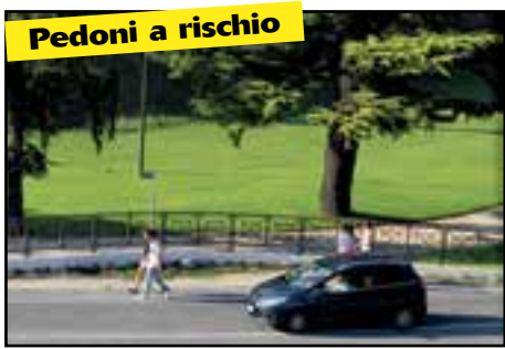
Pedoni a rischio

La decisione del sindaco e le sue dichiarazioni, dunque, hanno avuto l'effetto di acuire i contrasti in esse-