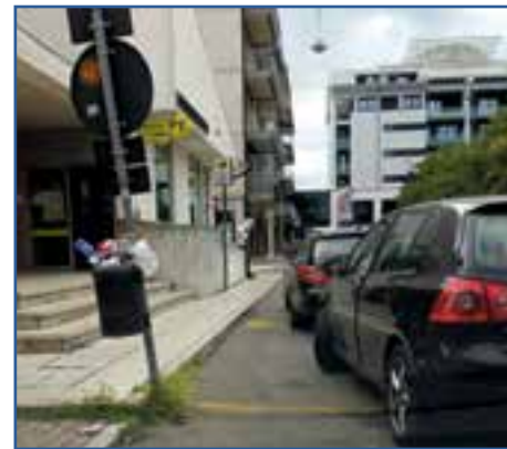
Parcheggio anche nel posto disabili e cestino che strabocca: una brutta immagine per Villafranca, segno di poco rispetto, nessuna cura e meno ancora controlli