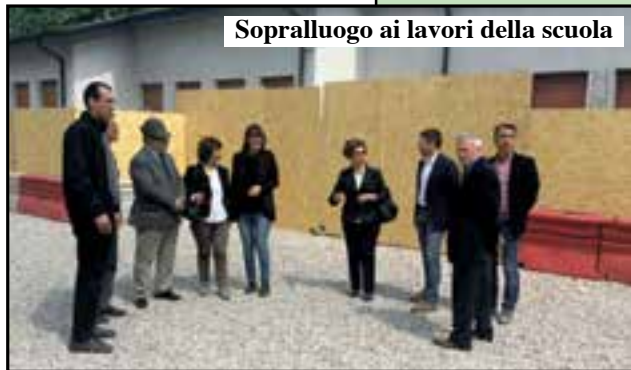
Sopralluogo ai lavori della scuola

Calano gli iscritti, addio dirigenza ma all'Istituto continuano gli investimenti nella riqualificazione e nei servizi