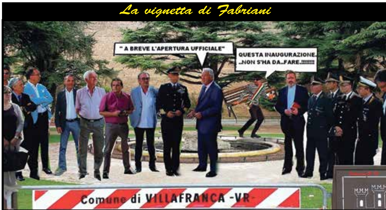
La vignetta di Fabriani

Ecco come il vignettista Bruno Fabriani vede in chiave umoristica la vicenda dell'incredibile situazione che si è creata ai giardini del Castello annunciato in apertura il 25 giugno e ancora chiusi di cui parliamo seriamente in altra pagina