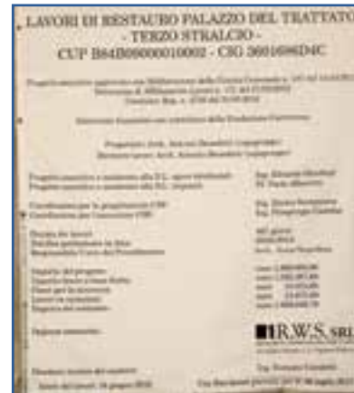
Il cartello dei lavori al Bottagisio, da due anni si aspetta l'apertura