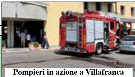
Pompieri in azione a Villafranca

Una vicenda tragicomica che si trascina dal 25 giugno. E la gente ha scelto di sfidare il Palazzo e le beghe interne