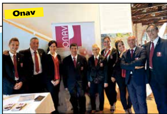
Onav E' ricominciata l'attività Onav con le serate di degustazione. Ad ottobre inizierà, invece, il tradizionale corso di 1° Livello per assaggiatore di vino. E' la 42ª edizione del corso che è da qualche anno diventato itinerante nelle cantine del territorio veronese.

Presentato il progetto per riqualificare il Centro. Tomicelli: «Questa struttura ha due anni di vita nominale, con questi lavori sarà prolungata di altri 50»