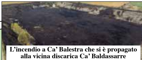
L'incendio a Ca' Balestra che si è propagato alla vicina discarica Ca' Baldassarre

Torna dal 4 al 6 settembre il viaggio nel gusto nelle tradizioni locali, nella storia e tra le bellezze del territorio