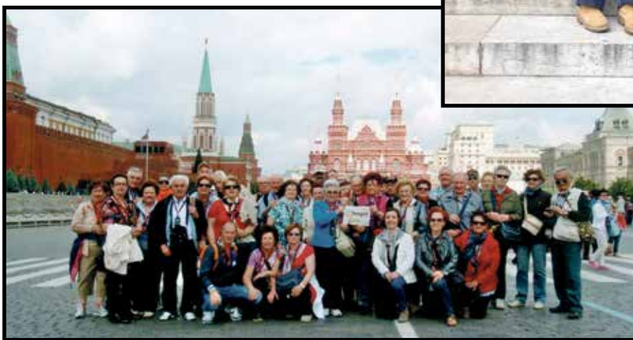
Un gruppi di amici di Povegliano in Russia