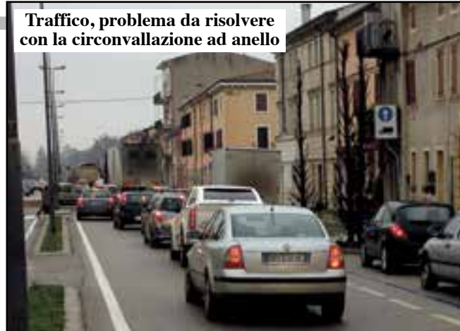
Traffico, problema da risolvere con la circonvallazione ad anello

Dall'Oca: «Anche se l'economia è giù, riscontri operativi entro 6/8 mesi»