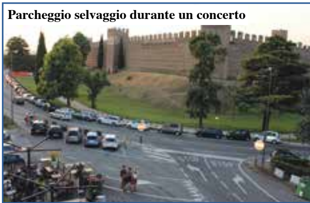
Parcheggio selvaggio durante un concerto

SEGNALETICA 1 - I lettori si divertono a segnalare cartelli stradali davvero divertenti. Sulla strada del nuovo Consorzio c'è un cartello di pericolo (vedi foto) ma è sbagliato. E' un dare la precedenza rovescio!