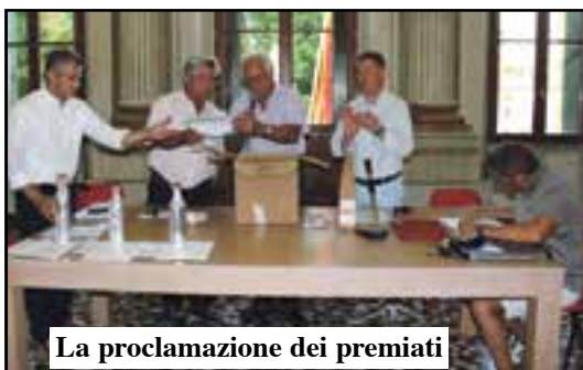
La proclamazione dei premiati

sche, broccetto e kiwi: «Il Custoza è un veicolo di promozione del territorio. Bene queste aziende che producono con qualità e valorizzano col loro lavoro la nostra terra».