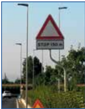
A sinistra lo strafalcione su Fb, al centro quello sul meteo e a destra un altro segnale stradale ... particolare