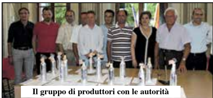
Il gruppo di produttori con le autorità