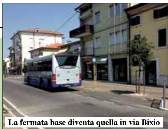
La fermata base diventa quella in via Bixio

Svolta nel trasporto pubblico. Dal 15 settembre entrerà in vigore il piano che prevede dalle 6 alle 20 corse per la città in grado di soddisfare le esigenze di tutti, da capoluogo e frazioni