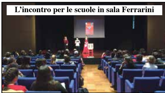
L'incontro per le scuole in sala Ferrarini