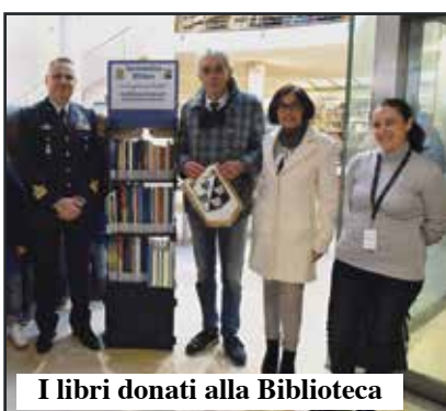
I libri donati alla Biblioteca

delle attrezzature, utilizzabili anche a favore della popolazione civile in situazioni di necessità ed emergenza e non solo in scenari