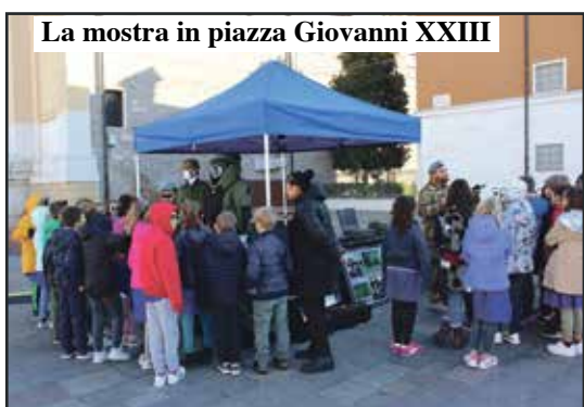
La mostra in piazza Giovanni XXIII

Cerimonia al monumento ai caduti, scuole in visita agli stand del 3° Stormo e libri donati dall'Aeronautica alla Biblioteca comunale a suggellare lo stretto rapporto con l'Amministrazione. Villafranca ha celebrato così la ricorrenza del 4 novembre. In Piazza Giovanni XXIII, il personale del 3° Stormo ha spiegato a studenti e cittadini l'impiego