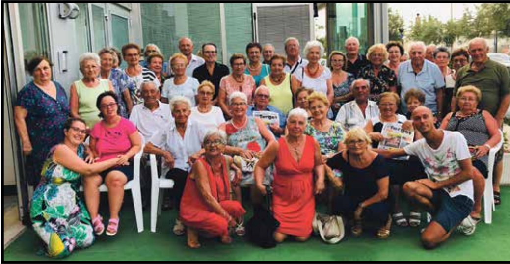
Foto del gruppo in vacanza a Senigallia, viaggio organizzato dal Comune di Villafranca. «Stessa spiaggia e stesso mare, senza Senigallia non sappiamo stare»

Scrivete sempre un recapito telefonico. Altrimenti non potrete essere selezionati per le premiazioni