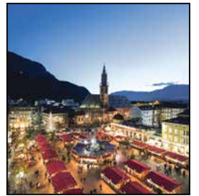
Piazza Walther, al centro di Bolzano, con il suggestivo mercatino di Natale

Ben 19 icone russe scelte con attenzione nella collezione di Intesa Sanpaolo dialogano e si confrontano con 45 opere, molte mai viste in Italia, realizzate tra la fine del XIX e l'inizio del XX secolo, provenienti - tra l'altro - dalla Galleria Tret'jakov, il più importante museo di arte russa di Mosca, per esplorare il tema del sacro nell'arte russa dall'ultimo scorcio dell'Ottocento e per concentrarsi sulle principali figure - come Kandinskij, Natalia Goncarova e Chagall, ma anche Petrov-Vodkin, Malevic e Filonov - che hanno rivelato, più di altri esponenti dell'Avanguardia, la profonda affinità tra la profonda concezione filosofico-teologica dell'icona e le ricerche spirituali ed estetiche degli esponenti dell'Avanguardia. Ecco la mostra "Kandinskij, Goncarova, Chagall. Sacro e bellezza nell'arte russa" aperta fino al 26 gennaio 2020 alle Gallerie d'Italia di Vicenza (orario: 10-18, lun chiuso; info: 800578875).