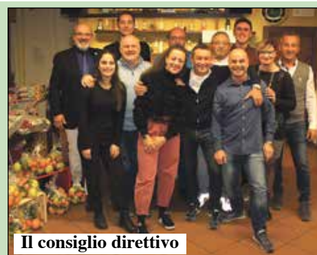
Il consiglio direttivo

Il direttore degli impianti di Obereggen