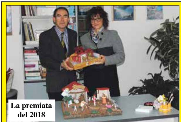
La premiata del 2018

In passato ognuno ha interpretato il presepe alla sua maniera: chi nel solco della tradizione, chi con grande fantasia ed abilità, scegliendo anche i materiali più disparati. Moltissimi i lettori che hanno dimostrato di apprezzare l'iniziativa recapitando in redazione numerose fotografie o spedendole via mail. Sul numero