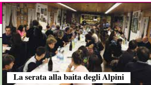
La serata alla baita degli Alpini