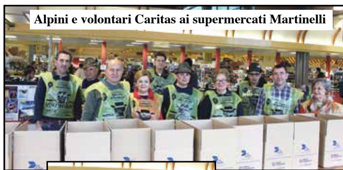
Alpini e volontari Caritas ai supermercati Martinelli

Villafranca si è messa a disposizione con la raccolta, organizzata grazie a Caritas S.Vincenzo, gruppo Alpini e semplici volontari, dei generi di prima necessità donati nei supermercati che hanno aderito all'iniziativa.