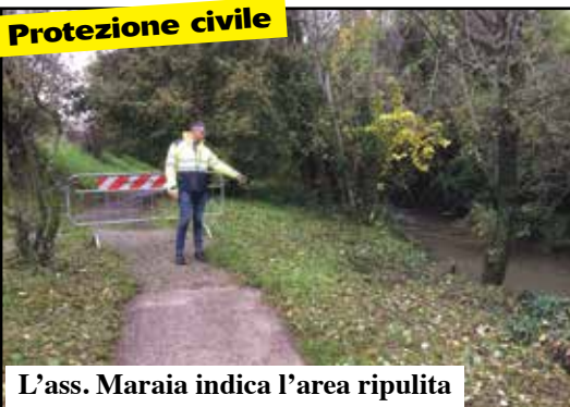
L'ass. Maraia indica l'area ripulita

Erano diversi anni che non si interveniva e, specie nel primo tratto, si era creata una selva oscura. Grazie all'esercitazione provinciale della Protezione Civile promossa dal Comune è stato riqualificato il tratto urbano del Parco del Tione da via Muraglie al ponte Adriano.