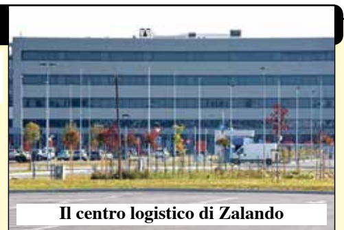
Il centro logistico di Zalando

Gi Group affiancherà FIEGE nel processo di reclutamento e selezione dei candidati con un progetto che vedrà impegnate tutte le filiali territoriali (Villafranca, Nogarole Rocca, Verona, Mantova) con un team di lavoro dedicato, offrendo supporto anche a tutti i candidati che vorranno orientar-