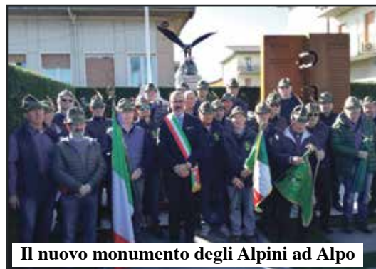
Il nuovo monumento degli Alpini ad Alpo

Ad Alpo il gruppo Alpini ha finalmente raggiunto il traguardo, inseguito da diversi anni, di ristrutturare col Comune il monumento ai caduti datato oramai una cinquantina d'anni. E' stata aggiunta una nuova lapide,