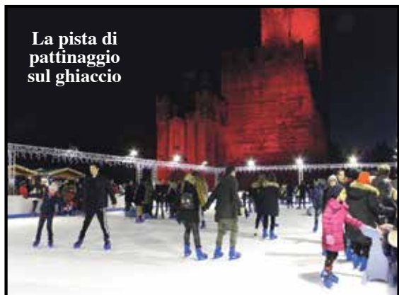
La pista di pattinaggio sul ghiaccio

Investimento senza precedenti per il Comune con l'obiettivo di portare tanta gente aiutando le attività e regalando eventi alla popolazione