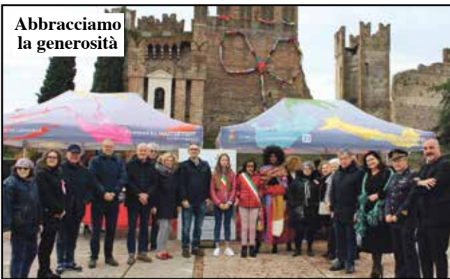
Abbracciamo la generosità

LE SCIARPE - L'evento clou è stato indubbiamente l'iniziativa promossa da Donne Insieme "Abbracciamo