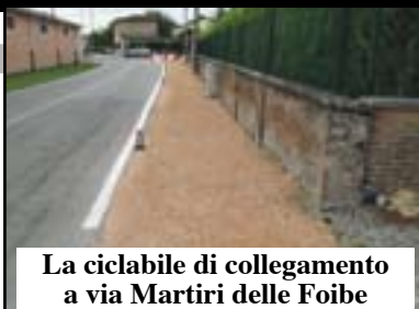
La ciclabile di collegamento a via Martiri delle Foibe