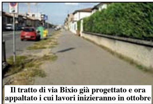
Il tratto di via Bixio già progettato e ora appaltato i cui lavori inizieranno in ottobre