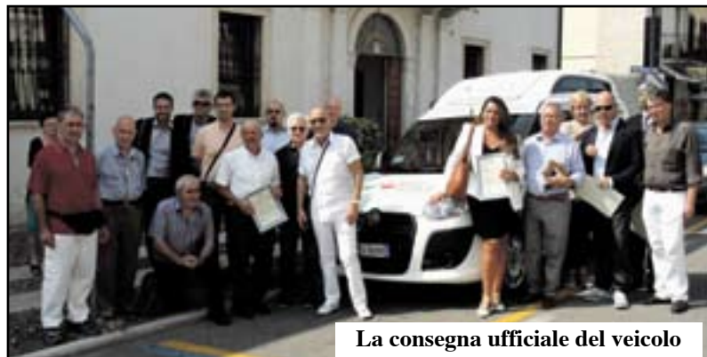
La consegna ufficiale del veicolo