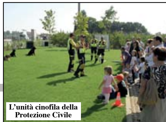
L'unità cinofila della Protezione Civile

ZONA ZAI - Umido (lunedì e venerdì), Plastica (mercoledì), Carta (martedì), Secco (giovedì), Verde (martedì 8 e 22). Giovedì 31 umido e secco.