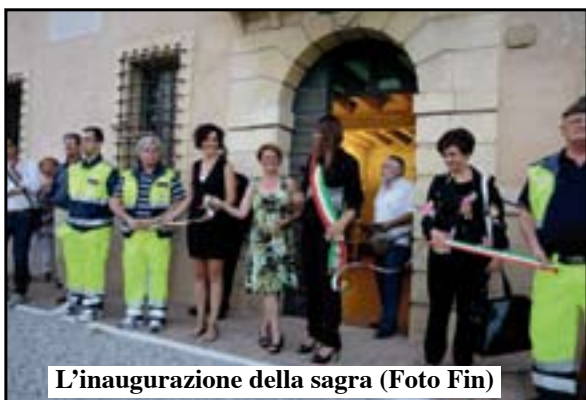
L'inaugurazione della sagra