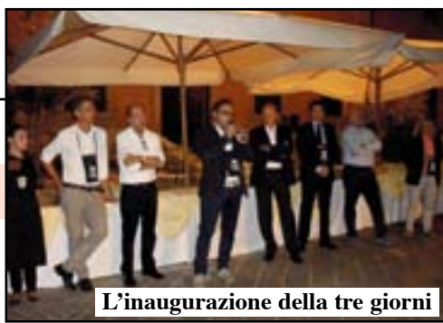
L'inaugurazione della tre giorni

Sinergia vincente tra le realtà in campo