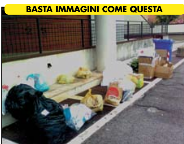
BASTA IMMAGINI COME QUESTA

Tenere il calendario della raccolta differenziata a portata di mano perché a ottobre cambiano i turni. E' un promemoria che facciamo noi a tutta la cittadinanza, visto che non lo fa il Comune che da mesi non batte più questo tasto, per evitare che succedano confusioni come purtroppo si è verificato in passato ogniqualvolta è cambiato il calendario della raccolta Porta a porta. Con il risultato di vedere in strada contemporaneamente rifiuti di ogni genere. Perché c'è chi ha ben chiaro il quadro del Porta a porta e chi inizia l'anno in un modo e poi non si cura dei cambiamenti. Come se il calendario il Comune e il Consorzio di Bacino lo avessero realizzato pro forma, un souvenir da mandare a casa alla gente. La conclusione è che poi il Comune deve mandare a pulire e