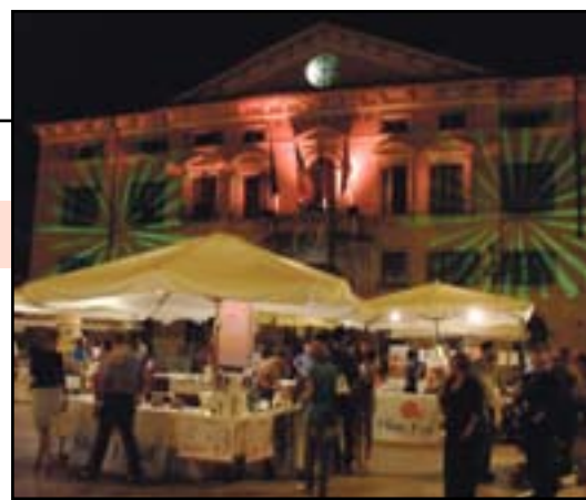
Una suggestiva immagine del municipio

Brentegani «Una passerella del meglio che offre Valeggio in tutti i settori»