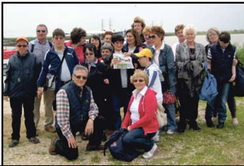
L'associazione Famiglie Disabili di Villafranca, Dossobuono e Valeggio ha organizzato un gita sul delta del Po. E ha portato Target

ATTENZIONE Se spedite le foto via posta o le portate a mano scrivete sempre un recapito telefonico. Altrimenti non potrete essere selezionati per le premiazioni