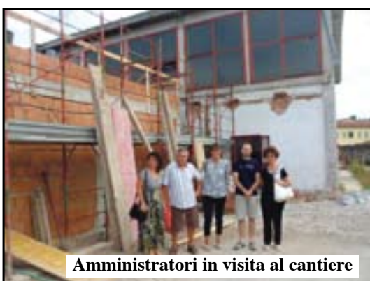
Amministratori in visita al cantiere

Procederemo con celerità per rendere agibile la palestra il prima possibile. Ci sono stati lacci burocratici e vincoli ma stiamo facendo il possibile per dare ai bambini una scuola efficiente».