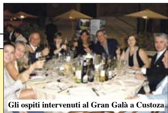
Gli ospiti intervenuti al Gran Galà a Custoza