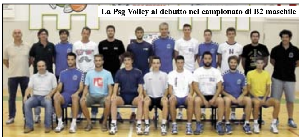
La Psg Volley al debutto nel campionato di B2 maschile