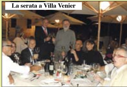
La serata a Villa Venier