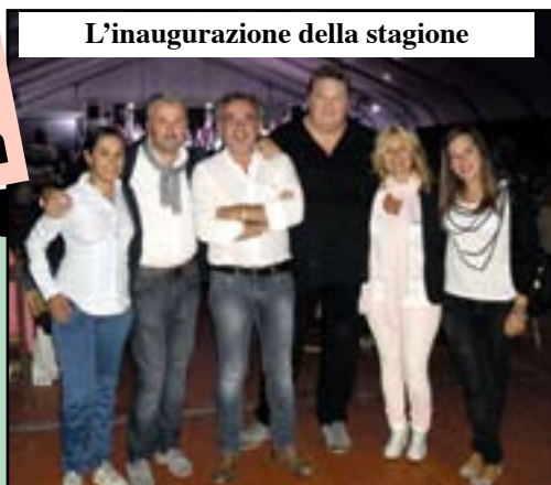
L'inaugurazione della stagione

Con il prossimo mese cambieranno i giorni del Porta a porta. Per chi non guarda mai il calendario, ecco riassunte le modifiche di tutte le zone di raccolta rifiuti