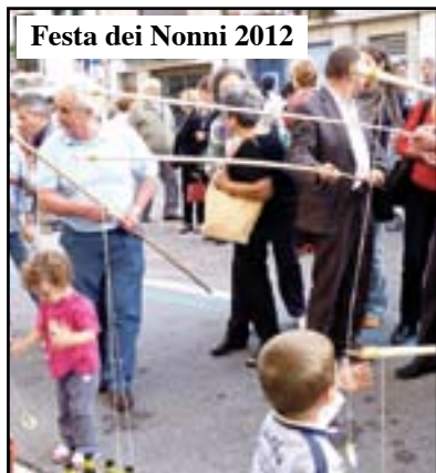
Festa dei Nonni 2012

La Festa dei Nonni, in programma domenica 6 ottobre, torna all'antico. Dopo alcune edizioni organizzate dal Comune in piazza Giovanni XXIII e corso Garibaldi, l'evento sarà di nuovo ospitato nel cortile del Centro Sociale di via Rinaldo.