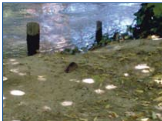
Nelle scorse settimane c'è stata un'emergenza topi nel parco del Tione lungo le rive del fiume

TOPI - Qualche settimana fa c'è stata una vera e propria emergenza topi nel parco lungo il Tione. Numerosissime le segnalazioni giunte in redazione per far presente il problema. Il tratto lungo il Tione incriminato è quello tra il semaforo di via Nino Bixio e il ponte Adriano, quello della strada che porta alle piscine. E' un tratto molto frequentato da anziani, bambini e animali, che potrebbero venire in contatto anche solo con i loro escrementi. Buttandola in ridere, che si riferissero ai topi gli ambientalisti quando ogni tanto propongono gite per vedere la fauna che popola il Tione?.