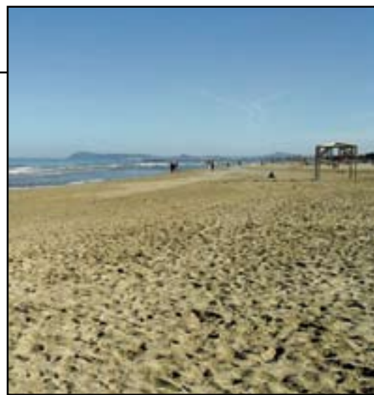
Sopra il bagnasciuga finalmente libero senza i banchetti dei vu cumprà che hanno caratterizzato la stagione estiva. Sotto la spiaggia senza ombrelloni