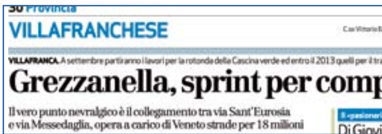
Sopra il titolo dell'Arena nell'articolo sulla Grezzanella A sinistra la vignetta sul problema degli escrementi dei cani

padroni, non i cani. Loro quando devono farla, la fanno. Ma se il padrone è un letamaio la lascia per terra, altrimenti la raccoglie.