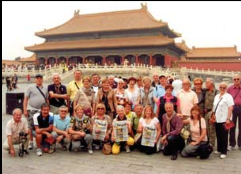
Il Gruppo Verona al gran completo a Pechino con Target davanti al palazzo imperiale dentro la città proibita e, sotto, alcuni gitanti davanti al tempio del Cielo