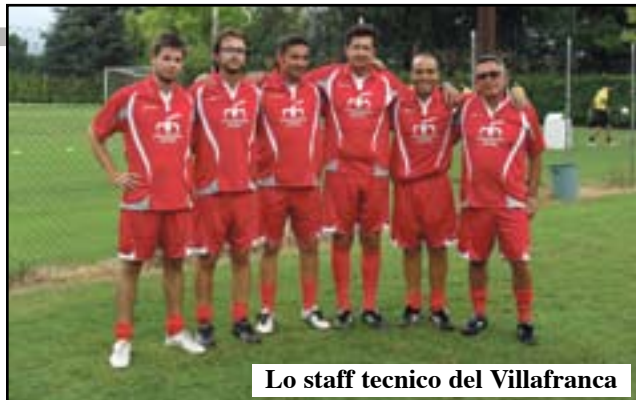
Lo staff tecnico del Villafranca

Nel complesso il mister però si mostra fiducioso: «Abbiamo bisogno di ancora un po' di tempo per vedere la squadra esprimersi al meglio, perché il gruppo che mi è stato affidato può far bene anche se deve crescere in personalità».