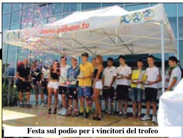
Festa sul podio per i vincitori del trofeo

La società si è mossa bene sul mercato per affrontare con tranquillità la prima stagione nel nuovo campionato di serie B2