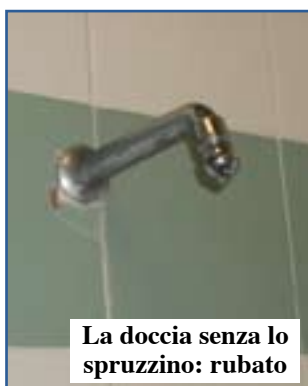
La doccia senza lo spruzzino: rubato

distrutti. Il secondo aspetto è che quando gli impianti vengono fatti bisognerebbe che fossero fatti bene. E basta guardarsi in giro