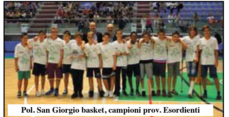
Pol. San Giorgio basket, campioni prov. Esordienti