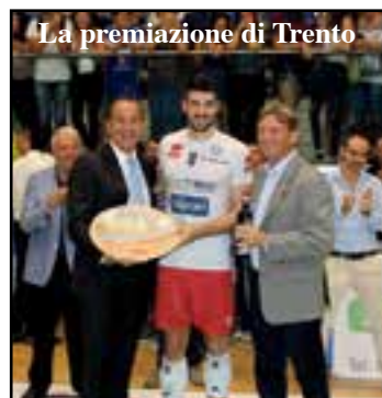
La premiazione di Trento

lo Sport, Basket e soprattutto Volley. Il rafforzamento della collaborazione tra la Psg e Bluvolley Verona sarà molto forte soprattutto nelle giovanili maschili, con atleti delle due società presenti in quasi tutte le squadre, una formazione Under 16 che giocherà al Medi, gialloverdi che saranno inseriti a