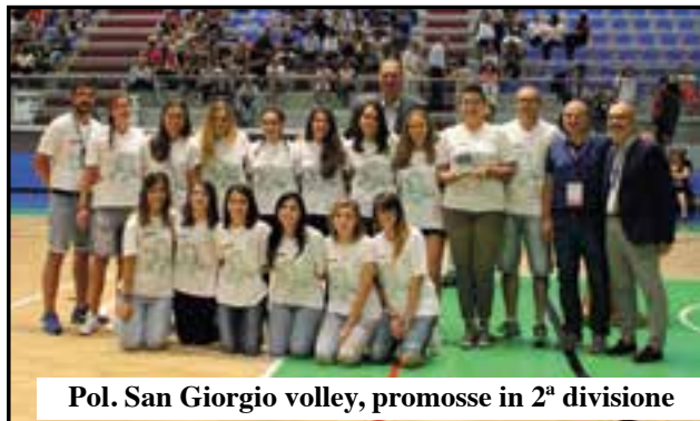
Pol. San Giorgio volley, promosse in 2 a divisione