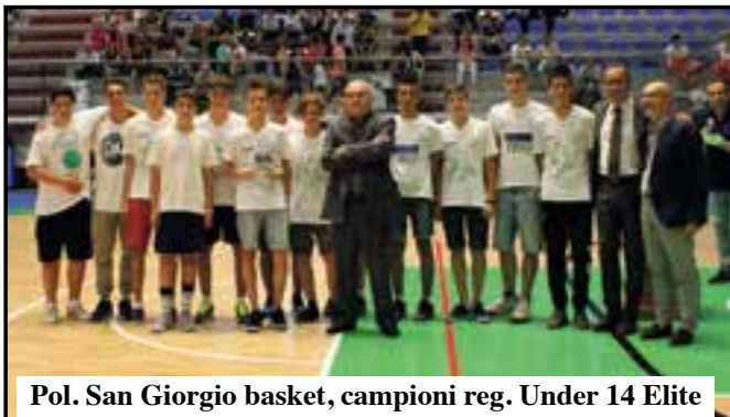
Pol. San Giorgio basket, campioni reg. Under 14 Elite