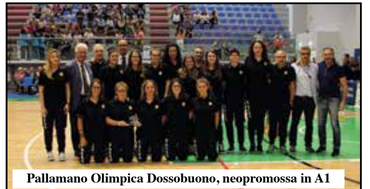
Pallamano Olimpica Dossobuono, neopromossa in A1