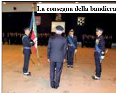
La consegna della bandiera

«Porterò sempre nel cuore questa bellissima esperienza villafranchese - ha aggiunto - perché professionalmente sono stato l'allenatore di una squadra fatta di fuoriclasse che è andata a farsi onore su tutti i campi in Italia, da ultimo Amatrice, e nel mondo. Per quanto riguarda il territorio circostante, poi, tutti, dalle autorità ai cittadini, ci fanno sentire la loro vicinanza. Ci sentiamo figli di que-