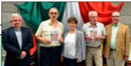
Gli autori del libro su Quaderni

Selciati divelti, rifiuti in giro, sporcizia e scritte sulle pareti, verde incolto e parcheggio selvaggio