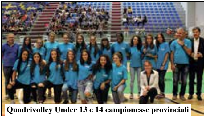
Quadrivolley Under 13 e 14 campionesse provinciali