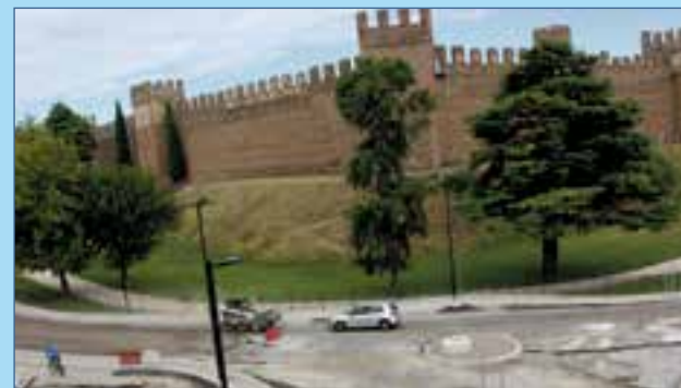
Ecco l'incredibile situazione che si è venuta a creare. Un automobilista ha seguito la ruspa per cercare di passare nonostante i divieti. A un certo punto la ruspa si è girata su se stessa e si è ritrovata questa macchina davanti che ancora non si spostava. Veramente assurdo.

a conoscenza degli imbarazzanti divieti che il sindaco ha messo a tutela del "suo" prato all'interno del Castello. E allora ci viene da sorridere ricordando cosa ha scritto l'Arena a resoconto del concerto di Max Gazzè: «Bambini che ballano, ragazze distese sul plaid, fiamme sparse abbracciate, sedute sul prato del Castello». Orrore! Come si sono permessi? Erano tutti in multa! E se per caso fosse piovuto, il concerto sarebbe stato annullato, visto che c'è il divieto di calpestare l'erba bagnata?