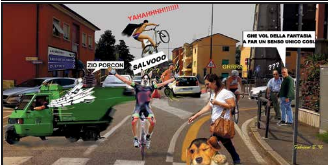
Ecco come il vignettista Bruno Fabriani vede in chiave umoristica la situazione della viabilità in via Pace un anno dopo la decisione di fare un senso unico e una pista ciclabile che entra in via Prina con uno stop a metà carreggiata