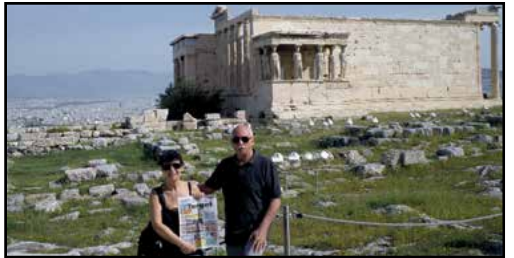
Da Atene, "culla della civiltà", le famiglie Saggio/Mecenero mandano un saluto ai lettori di Target.