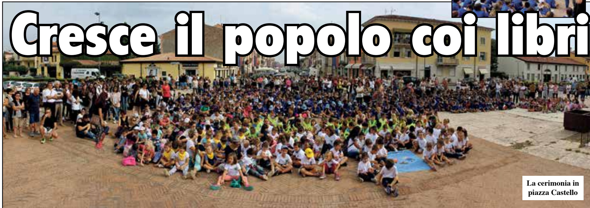
La cerimonia in piazza Castello

Al Cavalchini-Moro superati i 1900 alunni - A Dossobuono potenziamento di tedesco e musica