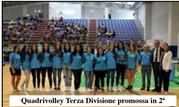
Quadrivolley Terza Divisione promossa in 2 a