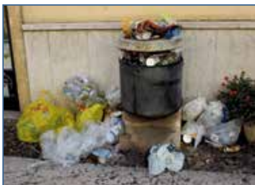
La bella immagine che dà il Comune nel cuore di Villafranca

brilla per non rispettare le regole. Cerca sempre di fare il furbo. E questo succede puntualmente anche a Villafranca. Vogliamo parlare della viabilità? Se c'è una strada chiusa per lavori ci sono sempre gli amanti dell'avventura che pensano «intanto passo poi vediamo» e si ritrovano in mezzo alle ruspe che lavorano (vedi foto). E nemmeno tornano subito indietro. Stanno a vedere se trovano un varco per passa-