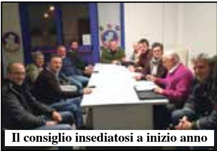
Il consiglio insediatosi a inizio anno

La Fondazione ha deciso dopo 6 anni un aumento 'Istat' del 6%