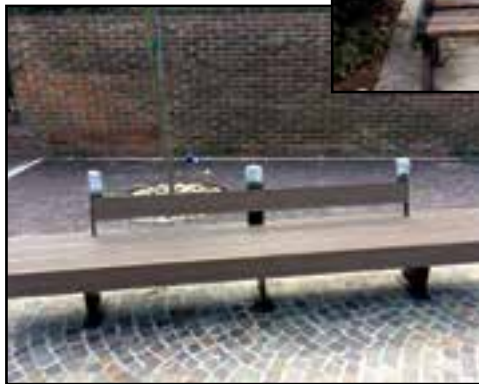
Sopra la panchina davanti alla campana. A sinistra la panchina di via Ospedale con sotto un bell'immondezzaio. Qui accanto la panchina alla rotonda di via Roma: l'hanno rovinata anche se è fatta in corten.