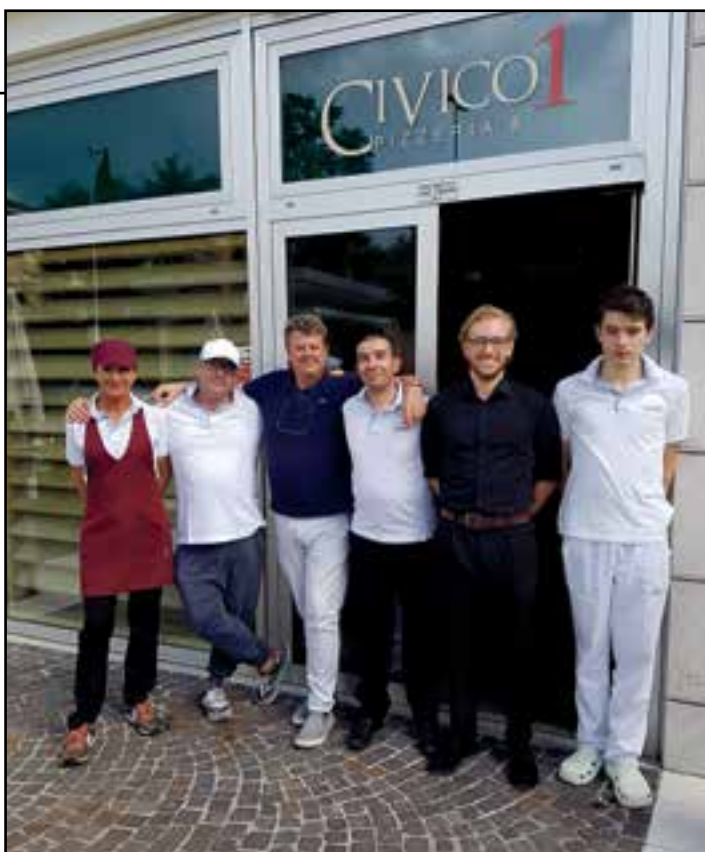
A sinistra il Civico 1 e a destra il Civico 2: un'unica grande squadra per soddisfare tutte le esigenze della clientela

La stessa squadra ma due locali diversi: uno più dinamico, uno più tranquillo