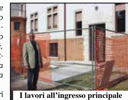
I lavori all'ingresso principale

La scuola media paritaria Don Allegri di Villafranca ha riaperto i battenti anche se, in realtà, non li ha mai chiusi: l'istituto cattolico, che adotta il sistema delle classi in movimento all'americana, è rimasto attivo anche in estate con il Grest per tutto il mese di agosto. «È stata una sorta di "Edizione-0" - dice il preside Paolo Chiavico - aperta agli alunni di tutte le Elementari e Medie. La proporremo di nuovo perché è un bell'aiuto alle famiglie. La formula del Grest al mattino e dell'assistenza-compiti il pomeriggio fornita dai nostri insegnanti, è stata vista, infatti, come il giusto avvicinamento alla ripresa della scuola». L'estate è stata anche l'occasione per svolgere alcuni lavori di adeguamento della struttura. Dopo l'ascensore, è stata creata una migliore accessibilità ai disabili nell'ingresso