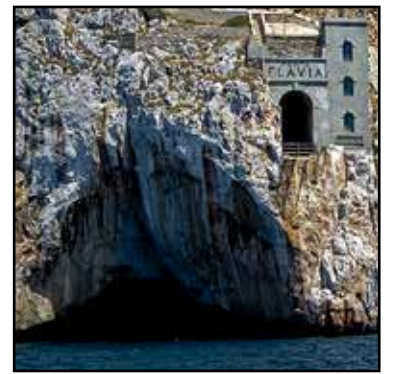
Sopra Porto Flavia, complesso del 1924 per recuperare i minerali dai depositi sotterranei. Sotto il tempio di Antas e la specialità mustazzeddu