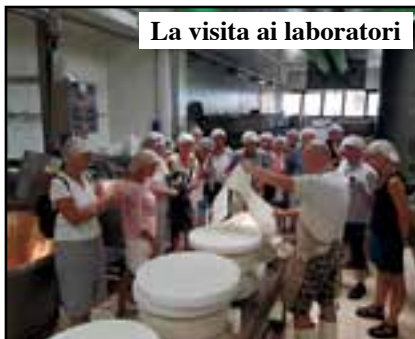
La visita ai laboratori