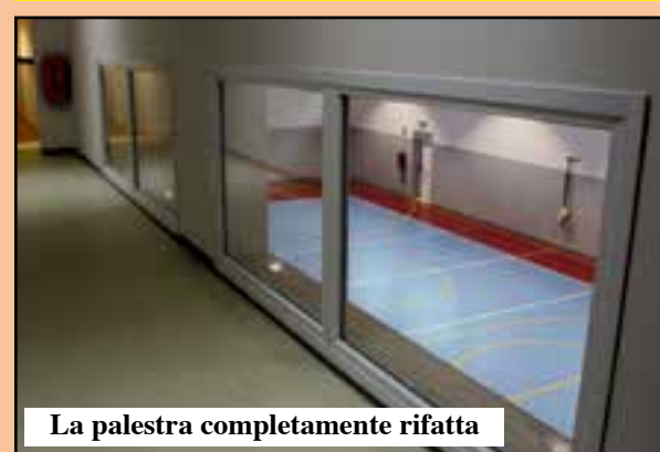
La palestra completamente rifatta