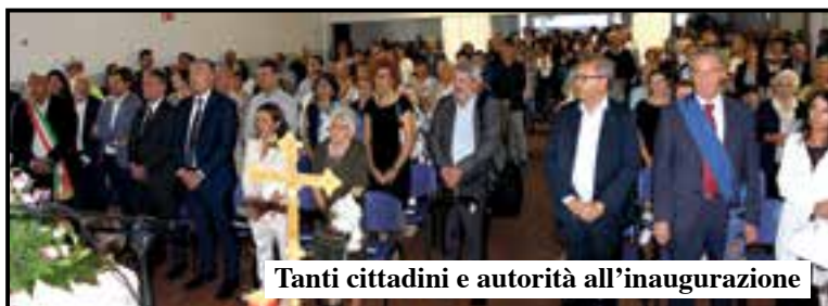
Tanti cittadini e autorità all'inaugurazione