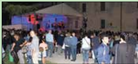
grafico Povegliano. Il giorno clou è stata la domenica col pienone, una serata per assaporare i piatti della cucina. Successo replicato al lunedì e al martedì con la zona ristorazione piena. «La

Sabato il freddo l'ha fatta da padrone, ma la vetrina è andata alla presentazione della preziosa coperta del '700 che rimane in esposizione a Villa Ballardoro dove erano presenti anche l'esposizione "10 Anni di Mosaico" di