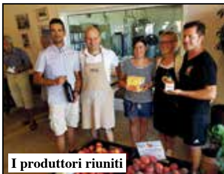
I produttori riuniti