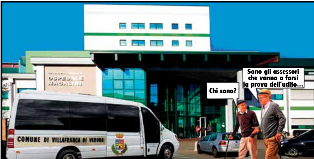
Ecco come il vignettista Bruno Fabriani vede in chiave umoristica gli effetti di quasi cinque anni di riunioni di giunta e di maggioranza con i decibel lanciati oltre ogni limite dal sindaco Mario Faccioli