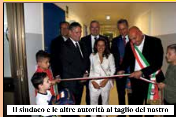
Il sindaco e le altre autorità al taglio del nastro