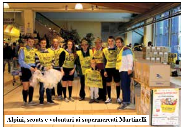
Alpini, scouts e volontari ai supermercati Martinelli

necessità. Addirittura siamo davanti a cifre record con 13.968 kg. di prodotti alimentari non deperibili che sono stati raccolti per il Banco Alimentare rispet-