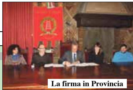
La firma in Provincia

Nel 2013 la richiesta. Dopo un solo anno dal Demanio è giunta la cessione gratuita al Comune di ben 26 ettari. «Sarà usata per attività a basso impatto ambientale a beneficio della comunità»