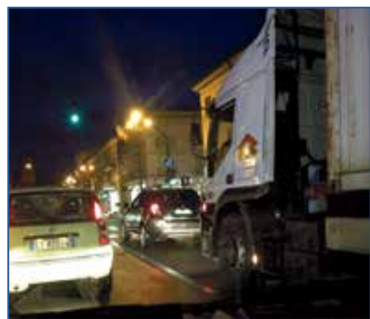
Un Tir al semaforo del centro in Cve e a destra l'aereo in via S.Giovanni della Paglia