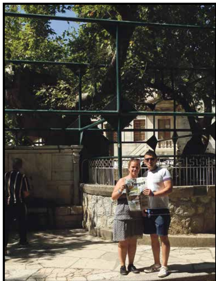
Una coppia di fidanzati nell'isola di Kos, in Grecia, sotto l'albero di Ippocrate a Kos città.

ATTENZIONE Se spedite le foto via posta o le portate a mano scrivete sempre un recapito telefonico. Altrimenti non potrete essere selezionati per le premiazioni