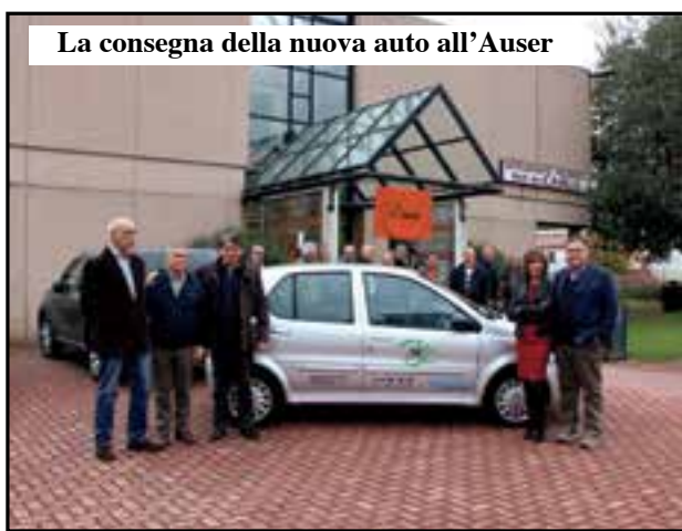
La consegna della nuova auto all'Auser

500 solo a Villafranca e a Dossobuono circa 350. A fine 2014 si arriverà a mille trasporti accompagnati. Sono i dati che ha fornito l'Auser che da anni gestisce questo tipo di servizio di trasporto protetto per anziani bisognosi di recarsi presso strutture sanitarie, ma che non