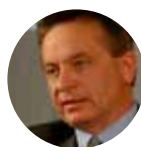
Franco Bonfante Consigliere regionale del Partito Democratico Vice Presidente del Consiglio regionale del Veneto