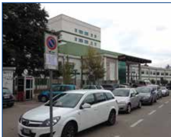
Il cartello di rimozione forzata in via Ospedale: ma è pieno di auto!

SEGNALETICA - Ogni tanto compare un segnale di rimozione forzata per lavori. Ma spesso succede che il tempo dedicato ai lavori è molto inferiore a quanto scritto sul cartello e la gente cosa fa? Se ne frega e parcheggia lo stesso (vedi foto) se non vede l'ombra di un camion, o di una ruspa, o di operai. Va bene prendersi larghi, ma insomma.