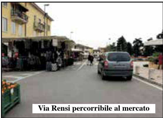
Via Rensi percorribile al mercato

Ora percorrendo il senso unico di via S.Francesco si può arrivare al parcheggio del Castello. «Uscendo dal parcheggio - spiega il consigliere Angiolino Faccioli - si può girare a destra