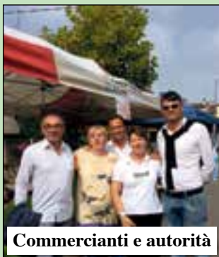
Commercianti e autorità