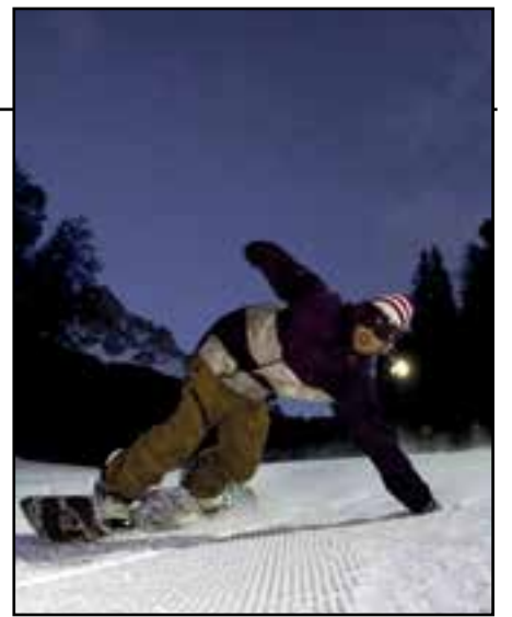
Sopra e sotto due immagini delle splendide piste innevate di Obereggen dove tutti, dai piccoli ai grandi, hanno la possibilità di sciare e fare snow

era formato, divenne il pittore più importante di Bruges. La mostra prende in esame ogni aspetto della sua opera, dalle pale monumentali d'altare ai piccoli trittici portatili, oltre ai celeberrimi ritratti, genere in cui Memling seppe perfezionare lo schema dipinto su uno sfondo di paesaggio, che esercitò una fortissima seduzione anche presso numerosi artisti italiani del primo Cinquecento. Oltre a capolavori di arte religiosa provenienti dai più importanti musei del mondo, tra cui dittici e trittici ricomposti per la prima volta in occasione della mostra.