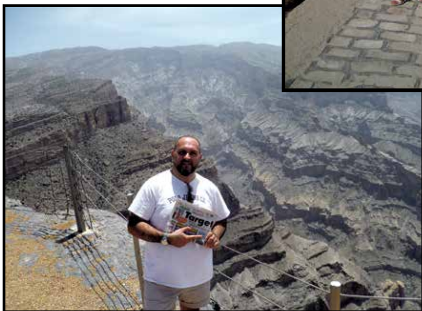
«Tanti saluti da Jebel Shams: coi suoi 3075 metri di altitudine è il monte più alto dell'Arabia che forma un impressionante canyon nel Sultanato dell'Oman»

ATTENZIONE Se spedite le foto via posta o le portate a mano scrivete sempre un recapito telefonico. Altrimenti non potrete essere selezionati per le premiazioni