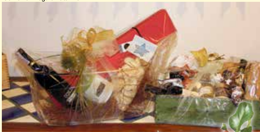
Confezioni regalo natalizie

vendita vino sfuso e birra artigianale austriaca sfusa.