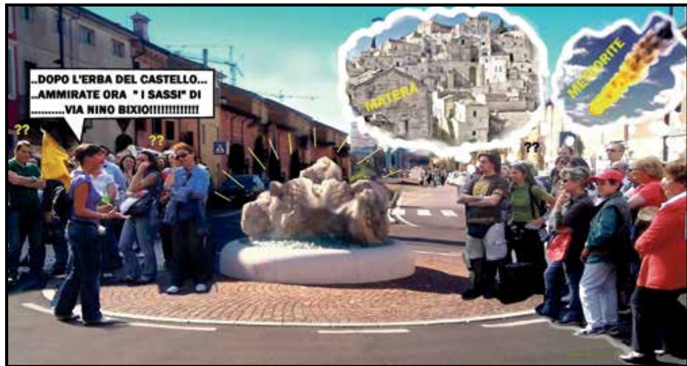
Ecco come il vignettista Bruno Fabriani ha visto in chiave umoristica il posizionamento dei due sassi nelle rotonde di via Bixio, una sorta di attrazione turistica con altre amenità castellane. Dopo i sassi di Matera, ecco quelli di Villafranca