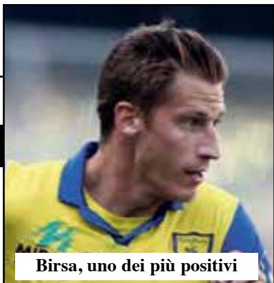
Birsa, uno dei più positivi