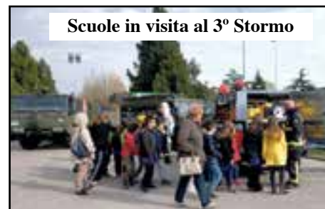
Scuole in visita al 3° Stormo

tualissimi di primo soccorso per il trattamento di pazienti critici ed il trasporto di malati altamente infettivi e biocontaminati. «Abbiamo il progetto "Il Fronte del Cielo" proposto dall'ass. "Il Circolo del 72" e dedicato all'Aviazione veneta nella Grande Guerra».