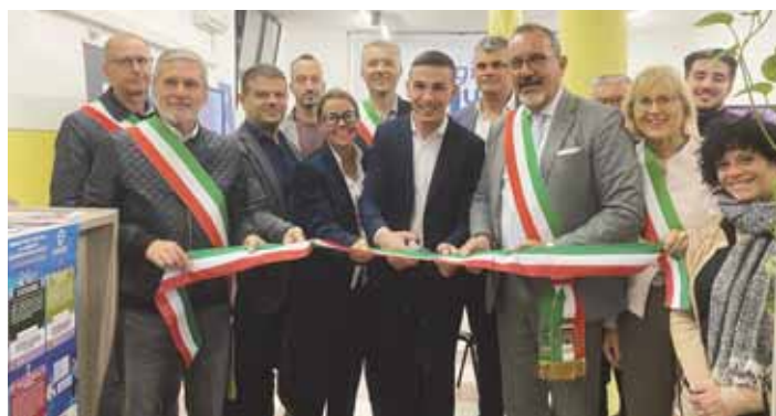
Gli amministratori al taglio del nastro del nuovo servizio di formazione