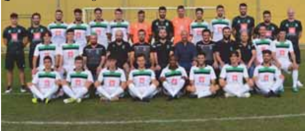
Quaderni Prima Categoria

novembre affronteranno il Valpolicella, ora quinto, il 12 ospiteranno il Consolini (terzo), il 19 il Cadidavid (quarto) e il 26 l'Alpo Lepanto (settimo).