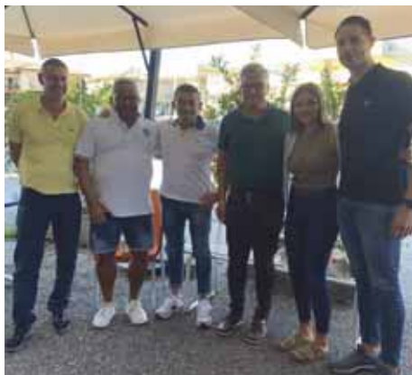
L'incontro allo Ski Club e, in basso, il rifugio Oberholz.

La presentazione è fissata per sabato 11 novembre con un aperitivo dalle 18 alle 20 alla Cantina Mene-gotti. Il tesseramento inizierà a metà del mese con l'obiettivo di consolidare i 300 iscritti. Cinque le uscite a Obereggen: domenica 21, 28 gennaio, 11, 18, 25 febbraio 2024 con la possibilità di seguire corsi di sci e snowboard come da tradizione, in collaborazione con la scuola di sci e snowboard Obereggen presieduta da Thomas Prinoth (chiusura iscrizione inseriti 10 gennaio 2024). Il programma è disponibile sul sito ( www.skiclubvillafranca.org ) e sui social dello Ski Club Villafranca. «Nonostante i rincari - sottolinea il