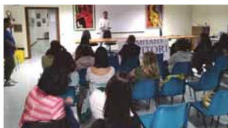
Un momento dell'incontro promosso dal Comitato Genitori alle Dante Alighieri

maggior numero di adolescenti sia gravemente dipendente da internet e dai social, diventando letteralmente schiavi del proprio cellulare. «È allarmante - prosegue il direttore dell'Antoniano - anche il problema della perdita di contatti e di relazioni reali a vantaggio delle relazioni virtuali». Oltre a diventare vittime di strumentalizzazioni commerciali, ogni foto, ricerca, like sono infatti feedback che orientano il mercato, e si diventa fruitori di proposte sempre più attinenti ai propri gusti, ma nel contempo