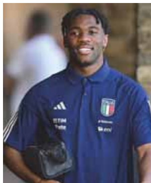
Destiny Udogie, classe 2002, cresciuto nel Nogara ha fatto il suo esordio nella nazionale di Spalletti

Da un anno la famiglia si è trasferita a Castelnuovo del Garda. Il talento di Udogie ha spazzato via anche i commenti beceri, circoscritti a pochi elementi oltretutto provenienti da fuori Nogara, riguardo al colore della pelle del calciatore, apparsi sotto un post di apprezzamento su Facebook dell'amministrazione comunale di Nogara. La maggior parte dei messaggi è stata di incoraggiamento e di plauso per il calciatore. In attesa anche di un altro nogarese, Federico Baschiroto , chiamato da Roberto Mancini ma ora fuori dal giro della Nazionale con il nuovo c.t. Spalletti. L'idea futura di avere due nogaresi in Nazionale sarebbe qualcosa di unico.