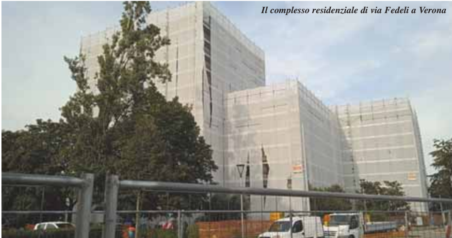
Il complesso residenziale di via Fedeli a Verona