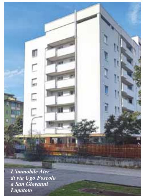
L'immobile Ater di via Ugo Foscolo a San Giovanni Lupatoto

Sono terminati da pochi giorni i lavori di riqualificazione di due complessi residenziali, con fondi regionali Por-Fesr 2014-2020, uno in via Fedeli a Verona (63 alloggi) e uno in via Ugo Foscolo a San Giovanni Lupatoto (52 alloggi). Gli interventi hanno visto una