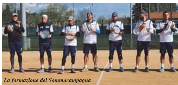
La formazione del Sommacampagna

Non è riuscito nell'impresa di mantenere la massima serie il Bardolino del