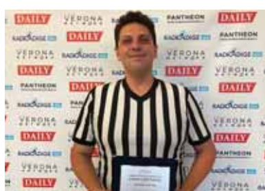
Jhonny Puttini arbitro internazionale wrestling