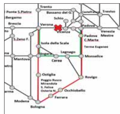
Dati di RFI

RELAZIONI AGGIUNTIVE: VE MESTRE - PADOVA LINEA STORICA CON FERMATE INTERMEDIE