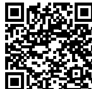
GUARDA L'INTERVISTA A LORENZO ZERBATO