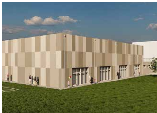
Il rendering digitale della futura palestra

La struttura sortgerà su un terreno comunale destinato all'ampliamento dell'istituto superiore di proprietà della provincia e consiste nella realizzazione di un'area sportiva che avrà una superficie di oltre 670 metri quadrati . All'ingresso troveranno posto due spogliatoi per studentesse e studenti, uno per gli insegnanti, un'infermeria/deposito. La nuova palestra sarà accessibile direttamente dagli istituti, tramite un passaggio di collegamento coperto, che dall'esterno, per favorirne l'utilizzo in orario extrascolastico, e verrà realizzata con soluzioni per ridurre i consumi energetici, quali l'utilizzo di sistemi isolanti ad alta efficienza e pannelli fotovoltaici sulla copertura. La fine del progetto è attesa per primi mesi del 2025.