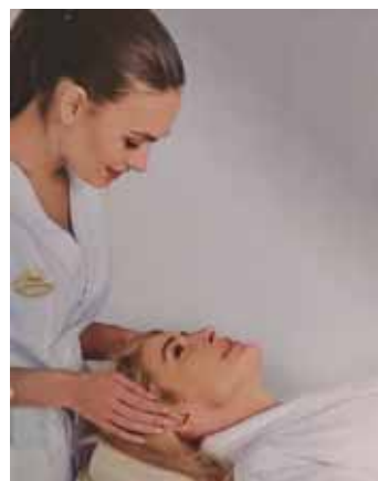
Se anche tu, vuoi una pelle morbida e luminosa passa da New Estetica Giuliana per un consulto gratuito.